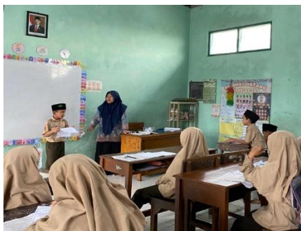
Gambar 3. Peserta Didik Mempraktikkan Storytelling di Depan Kelas

Permainan ini berhasil mencairkan suasana dan mengubah ketegangan menjadi kegembiraan. Ketika lagu berhenti dan seorang peserta didik mengambil spidol, dia dengan percaya diri melangkah di depan kelas untuk menceritakan pengalamannya. Melalui cara ini, setiap peserta didik mendapatkan kesempatan yang sama untuk melatih keberanian mental mereka di depan teman-temannya.