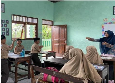
Gambar 2. Penerapan Media Talking Stick

Kereta Api", "Kalau Kau Suka Hati", dan "Bintang Kecil", di mana pada ketiga lagu tersebut, peserta didik yang memperoleh giliran adalah mereka yang memegang spidol saat lagu mencapai lirik bagian akhir. Peserta didik yang terpilih maju ada empat terdiri dari dua laki-laki dan dua perempuan.