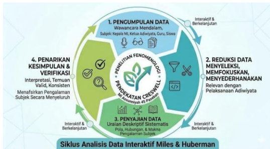
Gambar 1. Alur analisis data

data dari hasil wawancara mendalam kepada subjek penelitian untuk menggali informasi secara komprehensif, dan observasi partisipatif yang memungkinkan peneliti terlibat langsung dalam aktivitas, serta pengambilan dokumentasi berupa foto kegiatan, foto arsip sekolah dan catatan resmi yang sesuai dengan pelaksanaan Program Adiwiyata. Berikut siklus analisis data.