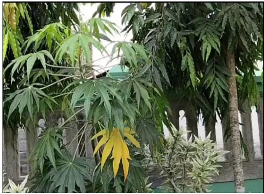
Gambar 2. Pohon Pinisilin obat luka

UKS yang digunakan untuk penanganan kesehatan siswa dimana obat yang disediakan adalah obat herbal alami yang secara langsung dari tanaman itu sendiri seperti minuman kesehatan untuk tubuh menggunakan kunyit, jahe, kencur, sereh. Obat luka atau antiseptik menggunakan getah dari pohon Pinisilin, obat sakit perut alami menggunakan daun Jarak. Tanaman ini disebarkan di daerah sekitar warga sekolah karena ketika membutuhkan tanaman ini sudah ada.