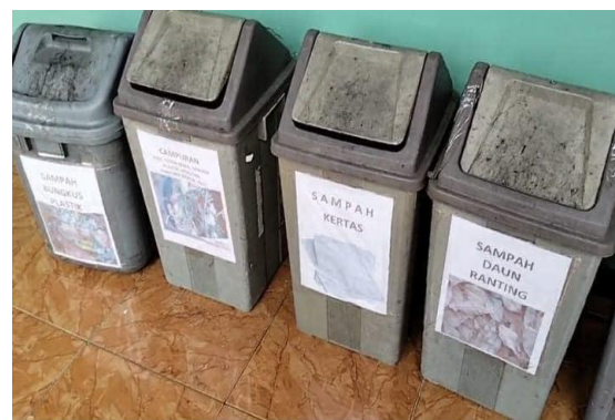
Gambar 5. Tempat pemilahan sampah

Dalam pelaksanaan pemilahan sampah madrasah menerapkan pemilahan sampah tim Adiwiyata bersama guru dengan memberikan pendampingan dan pembiasaan kepada peserta didik. Disamping itu, juga pentingnya mengembangkan nilai-nilai religius dengan mengajarkan bahwa membuang sampah itu sebagian dari pada iman, dan merupakan perbuatan baik yang bernilai ibadah, " satu sampah satu pahala" dengan cara ini meskipun fasilitas terbatas, siswa mulai terbiasa memilah dan mengolah sampah dengan 3R Reduce (mengurangi), Reuse (menggunakan kembali), dan Recycle (mendaur ulang), yang merupakan konsep dasar dalam pengelolaan sampah, sehingga secara tidak sadar peserta didik itu sendiri memiliki rasa kesadaran dalam menjaga lingkungannya tanpa tukang kebun pun lingkungan menjadi bersih dan terawat.