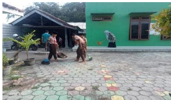
Gambar 6. Semua terlibat Guru dan Siswa

Dengan partisipasi siswa yang antusias terutama praktek langsung mereka belajar memilah sampah dan memahami bahwa sampah bisa dimanfaatkan kembali, kegiatan ini bertujuan untuk melatih kepedulian dan tanggung jawab siswa. Program ini diupayakan bukan hanya karena saat penilaian saja tetapi juga program ini menjadikan budaya yang berjalan terus menerus meskipun adanya kendala dalam keterbatasan sarana .