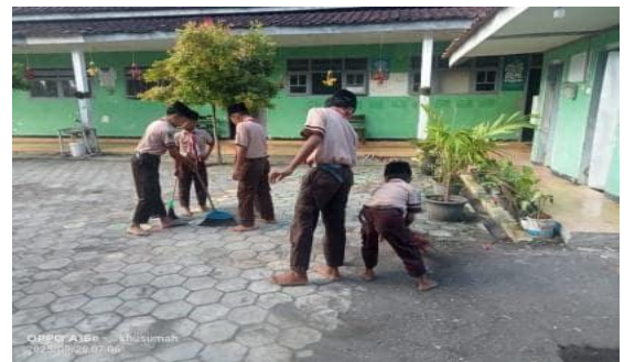
Gambar 8. kegiatan piket siswa

perusak baik itu lingkungan (polusi, penebangan liar), perusak jiwa seperti pembunuhan, perusak harta seperti pencurian dan kerusakan moral dan agama seperti berbuat maksiat. sehingga nilai religius bukan hanya sekedar dipelajari secara teoritis, melainkan juga diterapkan dalam rutinitas nyata sehari-hari. Dengan demikian nilai religius terinternalisasikan secara alami melalui tindakan yang menunjukkan rasa syukur, kepedulian, dan kesadaran terhadap lingkungan.