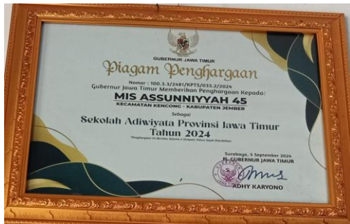
Gambar 3. Gambar Piagam penghargaan

UKS yang digunakan untuk penanganan kesehatan siswa dimana obat yang disediakan adalah obat herbal alami yang secara langsung dari tanaman itu sendiri seperti minuman kesehatan untuk tubuh menggunakan kunyit, jahe, kencur, sereh. Obat luka atau antiseptik menggunakan getah dari pohon Pinisilin, obat sakit perut alami menggunakan daun Jarak. Tanaman ini disebarkan di daerah sekitar warga sekolah karena ketika membutuhkan tanaman ini sudah ada.