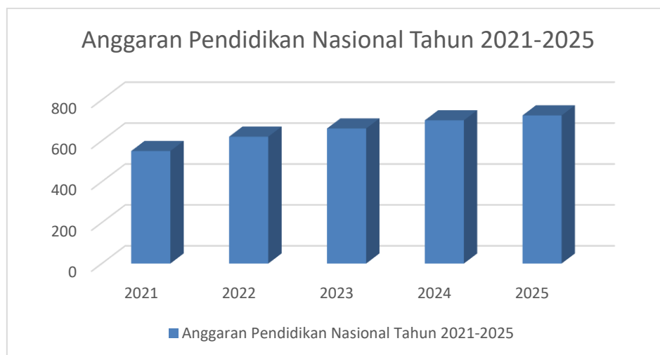
Gambar 2. Anggaran Pendidikan Nasional Tahun 2021–2025

Berdasarkan tabel tersebut, diketahui bahwa sebanyak 34,75% tenaga kerja merupakan lulusan SD ke bawah, dan sebagian besar tenaga kerja masih didominasi oleh lulusan SMP/SMA sebesar 52,00%, sementara itu lulusan pendidikan tinggi hanya sekitar 13,06%. Kondisi ini menunjukkan bahwa kualitas sumber daya manusia Indonesia masih relatif rendah. Rendahnya tingkat pendidikan ini berdampak langsung pada daya saing bangsa, terutama dalam menghadapi persaingan global yang semakin ketat. Di sisi lain, pemerintah terus menunjukkan komitmen dalam meningkatkan kualitas pendidikan melalui peningkatan anggaran pendidikan setiap tahunnya.