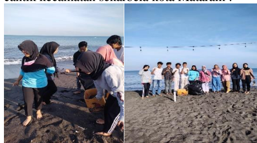
Gambar 1. Bersih pantai kawasan sunset land

kuliner yang berlokasi bersebelahan dengan pantai cantik kecamatan sekarbela kota Mataram .