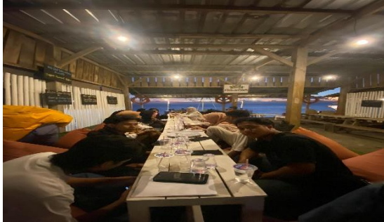
Gambar 2. Tahap Sosialisasi pelatihan dan ramah tamah

jaminan produk halal. Selain, Peraturan Pemerintah (PP) Nomer 39 tahun 2021 tentang Jaminan Produk Halal juga mengatur tentang sertifikat halal.