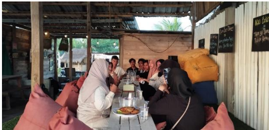
Gambar 3. pendampingan pembuatan sertifikat halal bersama BPJPH