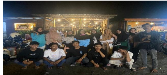
Gambar 4. Kegiatan pengabdian kepada masyarakat dengan peserta 15 orang

Kegiatan Pendampingan dengan para peserta. Dalam beberapa tahap pertama adalah Verifikasi dan validasi pernyataan pelaku usaha: kedua Pendamping Proses Produk Halal (PPH) melakukan verifikasi dan validasi atas pernyataan pelaku usaha. Kunjungan lapangan: proses produk halal melakukan kunjungan lapangan untuk melaksanakan pendampingan., Pengecekan ulang: Jika sudah dilakukan perbaikan, PPH akan melakukan pengecekan ulang. Agar pendampingan atas kunjungan kita tidak sia-sia. tahap ketiga Submit dokumen yaitu Setelah selesai, pelaku usaha baru bisa submit dokumen melalui akun yang di milikinya. kegiatan pengabdian kepada masyarakat dilanjutkan dengan terhadap mitra selama 1 bulan setelah itu baru mengevaluasi hasil selama pendampingan yang timpengabdian lakukan.. dengan 15 peserta pelatihan dan pendampingan.