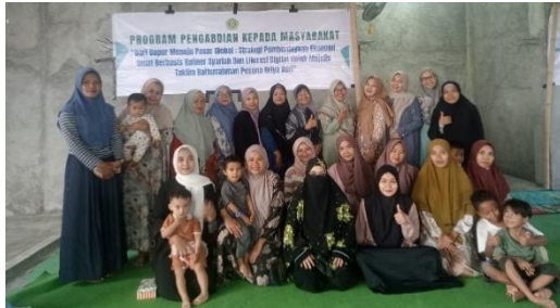
Gambar 3. Foto bersama dengan Ibu-ibu Majelis Taklim Baiturrahman Pesona Griya Asri

teknologi. Hal ini mengkonfirmasi Technology Acceptance Model (TAM) yang dikembangkan Davis (1989), yang menyatakan bahwa persepsi kemudahan penggunaan (perceived ease of use) dan persepsi kegunaan (perceived usefulness) adalah dua faktor utama yang menentukan tingkat adopsi teknologi oleh pengguna (Septyanun et al., 2022).