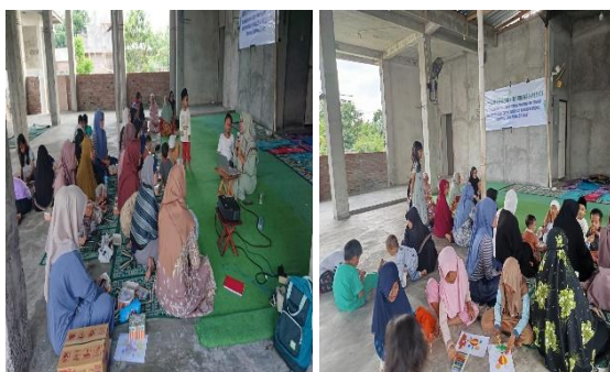
Gambar 2. Sosialisasi dengan Ibu-ibu Majelis Taklim Baiturrahman Pesona Griya Asri