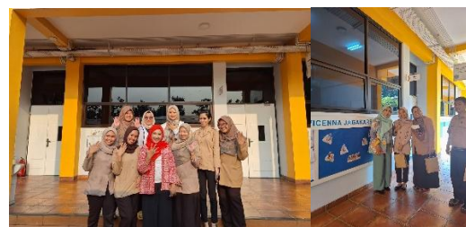
Gambar 3. Foto beberapa peserta kegiatan sosialisasi

Secara keseluruhan, kegiatan sosialisasi dipandang sebagai kegiatan yang baik menurut para peserta. Sebagian besar peserta seperti terlihat pada gambar 3 beranggapan bahwa materi sosialisasi yang disajikan secara sederhana, padat dan informatif.