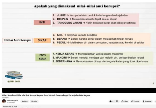
Gambar 1. Materi Slide ke-4 Nilai-nilai antikorupsi

Topik materi sosialisasi nilai-nilai antikorupsi yang tertuang dalam video adalah sebagai berikut. Slide ke-1 merupakan pengantar dan pengenalan. Slide ke-2 menguraikan keterkaitan nilai-nilai antikorupsi dan perwujudan bela negara. Slide ke-3 berupa tiga aspek utama nilai-nilai antikorupsi. Slide ke-4 merupakan penjelasan mengenai 9 nilai antikorupsi seperti terlihat pada Gambar 1 tentang nilai-nilai antikorupsi. Slide ke-5 membahas pentingnya nilai-nilai antikorupsi dimiliki sejak usia dini.