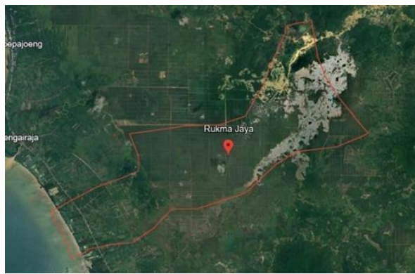
Gambar 1. Peta Desa Rukma Jaya

Penelitian ini membahas dampak dan perubahan ekonomi akibat perkebunan kelapa sawit terhadap masyarakat Desa Rukma Jaya yang terletak di Kecamatan Sungai Raya Kepulauan, Kabupaten Bengkayang. Desa Rukma Jaya merupakan bagian integral dari wilayah Kecamatan Sungai Raya Kepulauan. Secara geografis, desa ini adalah yang terbesar di kecamatan tersebut dengan luas wilayah 11.500 hektar, menjadikannya desa terbesar kedua dari lima desa yang ada di Kecamatan Sungai Raya Kepulauan, sementara desa terkecil adalah Desa Sungai Keran.