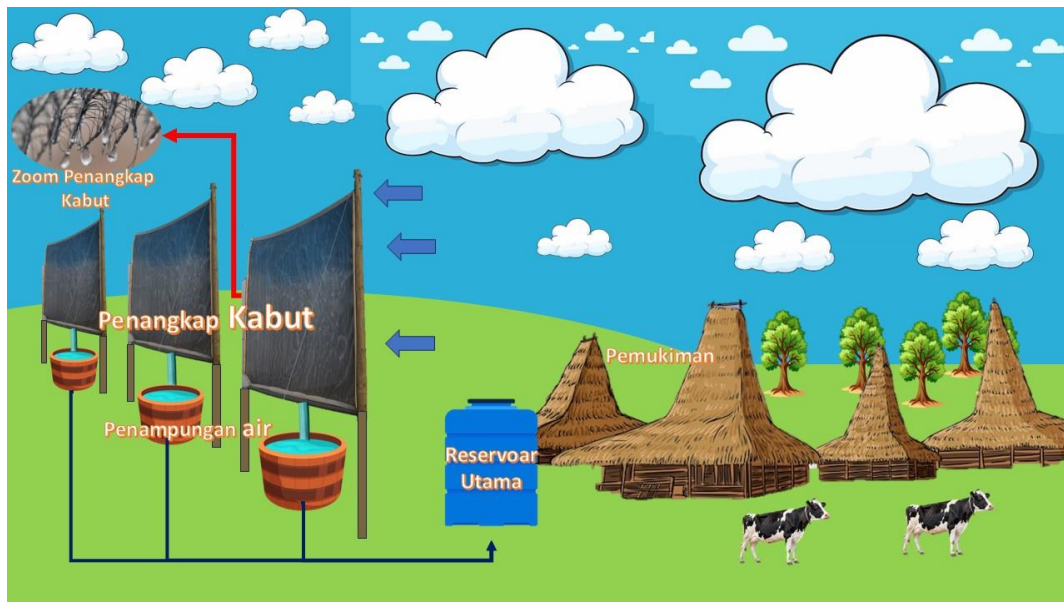
Gambar 2. Konsep sistem fog cather yang akan diimplementasikan di Desa Sisi, Kecamatan Kobalima, Kabupaten Malaka, NTT.

Asumsi perhitungan luas penampang sistem fog catcher atau penangkap kabut (Gambar 2) dengan RAB (Rencana Anggaran Biaya 1 buah sistem) diperkirakan secara umum tidak lebih dari 2 juta. Biaya yang digunakan yaitu pada pembelian jaring raschel mesh ukuran 3x3 meter dengan harga setiap meter