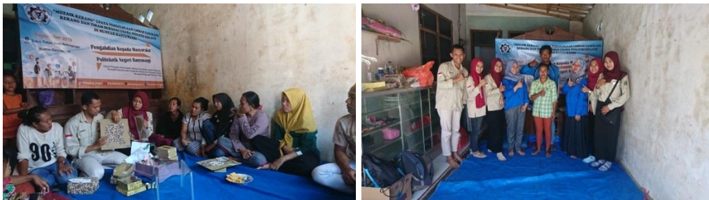
Gambar 2. Pelaksanaan Sosialisasi dan Pembentukan Kelompok Usaha Industri Kreatif Mozaik Kerang

Setelah mengadakan acara sosialisasi mengenai upaya pengelolaan limbah cangkang kerang dan tiram, langkah selanjutnya yaitu pembentukan kelompok usaha industri kreatif yang dinaungi oleh Ketua RT Dusun Tratas. Dalam acara sosialisasi tersebut dihadiri oleh Ketua RT dan 20 peserta yang terdiri dari pemuda dan ibu-ibu rumah tangga Dusun Tratas, Kedungringin. Acara sosialisasi ini dilaksanakan pada tanggal 14 September 2019 yang bertempat di wilayah Dusun Tratas, Desa Kedungringin, Muncar. Dalam kegiatan ini banyak peserta yang ingin ikut akan tetapi terhalang dengan kesibukan rumah tangga.