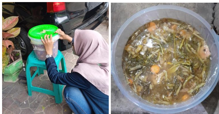
Gambar 7. Pengecekan eco enzyme pada hari ke-7 di RT 04 dan RT 02, RW VII

enzyme oleh warga RW VII sudah sesuai dengan indikator yang telah ditetapkan, seperti terlihat pada Gambar 7.