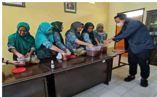
Gambar 5. Praktik pembuatan eco enzyme oleh peserta pelatihan, pencampuran dan peremasan bahan organik sampah dapur dengan air dan gula ke dalam wadah sebelum ditutup untuk disimpan.

Pelatihan berupa praktik bersama pembuatan eco enzyme yang dilaksanakan setelah sosialisasi pada hari dan tempat yang sama. Proses pembuatan eco enzyme dilakukan oleh tiap-tiap perwakilan RT dengan didampingi oleh mahasiswa KKN-DM untuk setiap tahapannya, seperti terlihat pada Gambar 5.