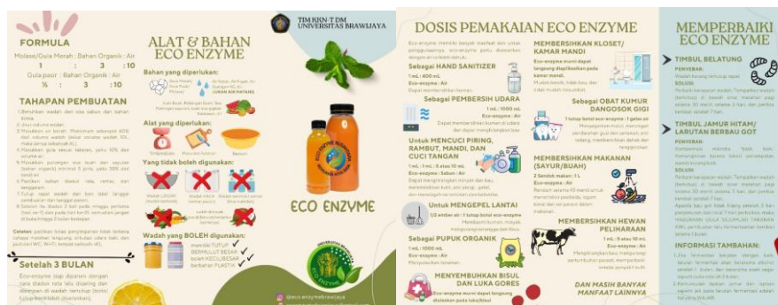
Gambar 1. Flyer eco enzyme yang telah disiapkan oleh tim mahasiswa untuk dibagikan kepada peserta agar peserta dapat mempraktekkan kembali di rumah

Limbah merupakan bahan bekas pakai atau sisa yang tidak terpakai dari suatu kegiatan dalam proses produksi. Limbah dalam hal ini sudah tidak dapat berfungsi seperti bahan aslinya. Limbah juga tidak dapat dikonsumsi oleh hewan dan manusia (Ismadi Megah et al., 2018). Adapun yang termasuk dalam limbah rumah tangga antara lain sisa bahan dapur, sisa kulit buah. Bahan-bahan yang tidak boleh dipergunakan saat pembuatan eco enzyme diantaranya adalah buah yang mengandung minyak seperti buah kelapa, alpukat, dan kemiri, sisa hasil masakan, serta sisa sayuran/kulit buah yang sudah busuk. Tim mahasiswa menyiapkan alat dan bahan selain limbah organik, serta menyiapkan flyer seperti pada Gambar 1.