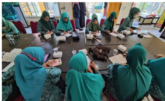
Gambar 3. Pengerjaan pre-test oleh ibu-ibu peserta pelatihan, untuk mengetahui tingkat pengetahuan peserta sebelum dilakukan kegiatan pelatihan pembuatan eco enzyme dengan memanfaatkan sampah dapur.