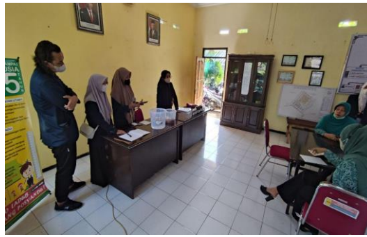
Gambar 4. Penyampaian materi oleh mahasiswa KKN-DM terkait alat dan bahan yang akan digunakan beserta contoh cara pembuatan eco enzyme .