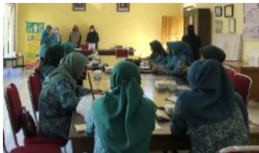
Gambar 2. Penyampaian sambutan oleh perwakilan ketua RW VII agar peserta memahami latar belakang dan tujuan dilaksanakan kegiatan pelatihan.

Dalam sosialisasi disampaikan bahwa pembuatan eco enzyme selain sebagai upaya melestarikan lingkungan, juga bermanfaat untuk berbagai bidang. Misalnya mengurangi penggunaan bahan kimia yang sering digunakan untuk pembersih rumah tangga, dan lain sebagainya. Pada saat sosialisasi peserta begitu antusias dan aktif sehingga terdapat pertanyaan menarik dan bermanfaat bagi peserta lainnya, seperti terlihat pada Gambar 2, Gambar 3 dan Gambar 4.