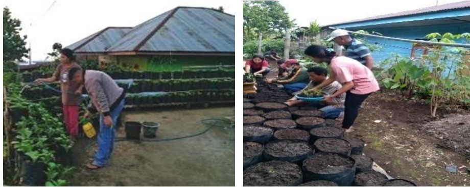
Gambar 3. Kegiatan Penanaman Bibit dan Perawatan Tanaman.

Untuk menyikapi keberlanjutan dari kegiatan penyuluhan yang sudah dilaksanakan maka adapun kegiatan teknis, seperti terlihat pada Gambar 3.