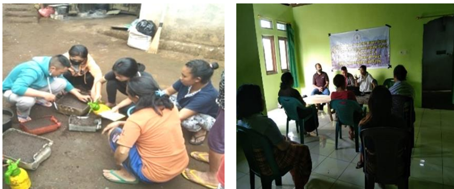
Gambar 2. Kegiatan Sosialisasi dan Penyemaian Benih.

Partisipasi aktif pihak mitra selama penyuluhan berlangsung menunjukkan bahwa kegiatan penyuluhan yang dilakukan benar-benar berdampak positif bagi mereka. Hasil diskusi selama proses penyuluhan telah memberikan pemahaman bagi masyarakat mitra yang diketahui dari kemampuan dalam menjelaskan kembali materi. Selama kegiatan penyuluhan berlangsung, adapun penerapan simulasi singkat mengenai metode persiapan media tanam, cara persemaian benih, cara pemupukan, dan pengendalian hama penyakit pada tanaman, seperti terlihat pada Gambar 2.