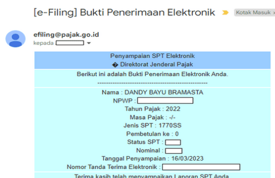
Gambar 2. Contoh Bukti Penerimaan Elektronik SPT