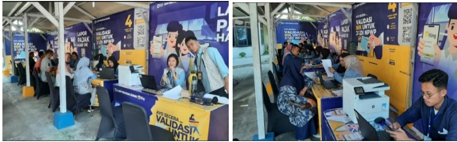
Gambar 1. Bimtek Relawan Pajak