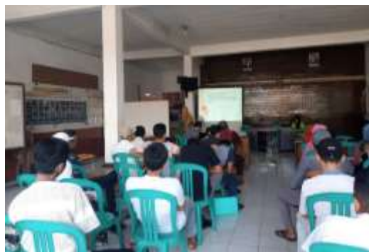
Gambar 2. Kegiatan Sosialisasi Pengabdian

Tahapan pengabdian berikutnya adalah Tahap pelaksanaan aksi diawali dengan kegiatan sosialisasi kepada peserta mengenai karakteristik dan bahaya zat warna tekstil sintesis yang digunakan dalam proses pewarnaan kain tenun Trosro, serta dampaknya terhadap lingkungan dan kesehatan. Materi sosialisasi disampaikan secara kontekstual dengan mengaitkan pengalaman sehari-hari peserta dalam proses pewarnaan kain, sehingga peserta dapat memahami hubungan antara aktivitas produksi yang dilakukan dengan potensi pencemaran lingkungan di sekitarnya, seperti terlihat pada Gambar 2.