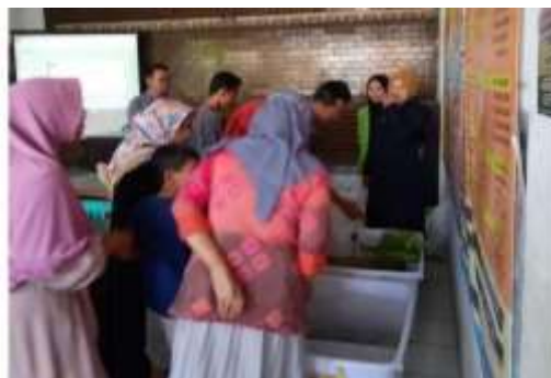
Gambar 3. Kegiatan Sosialisasi Pengabdian

Setelah kegiatan sosialisasi, dilanjutkan dengan demonstrasi pengolahan limbah cair menggunakan alat wastewater treatment berbasis fitoremediasi. Demonstrasi ini bertujuan untuk memperkenalkan alternatif teknologi pengolahan limbah yang sederhana, mudah dioperasikan, dan sesuai dengan kondisi industri tenun skala kecil. Peserta dilibatkan secara langsung dalam proses pengoperasian alat menggunakan limbah cair sisa pencelupan kain tenun Troso, mulai dari tahap pemasukan limbah hingga pengamatan perubahan karakteristik visual limbah setelah melalui sistem pengolahan. Melalui keterlibatan langsung tersebut, peserta tidak hanya memahami prinsip dasar kerja teknologi fitoremediasi, tetapi juga memperoleh pengalaman praktis dalam mengelola limbah cair secara mandiri. Kegiatan demonstrasi ini sekaligus menjadi media pembelajaran bagi peserta untuk mengenali potensi pemanfaatan bahan-bahan alami dan tanaman yang mudah diperoleh di lingkungan sekitar sebagai bagian dari sistem pengolahan limbah, seperti terlihat pada Gambar 3.