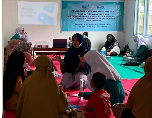
Gambar 4. Penjelasan materi leaflet kepada peserta Ibu hamil.

hamil sebelum dan setelah kegiatan. Perubahan ini berdampak positif pada aspek peningkatan pengetahuan ibu hamil yang berarti kegiatan pengabdian kepada masyarakat ini bermanfaat untuk ibu hamil di Desa Beleka Kecamatan Gerung, Kabupaten Lombok Barat, seperti terlihat pada gambar 4 dan Gambar 5.