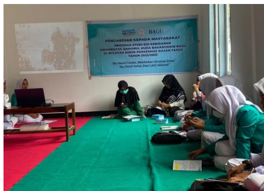
Gambar 3. Penyampaian materi edukasi anemia dan KEK.

Kegiatan pengabdian kepada masyarakat ini menggunakan metode ceramah dengan media powerpoint dan leaflet kepada kelompok ibu hamil di aula Kantor Desa Beleka. Kegiatan ini telah dilaksanakan pada bulan November 2022. Ibu Hamil yang terlibat sebagai peserta dalam kegiatan ini berasal dari dua Dusun yaitu; Dusun Beleka dan Dusun Mendagi yang berjumlah 22 ibu hamil. Selanjutnya kegiatan dimulai dengan melakukan survei lokasi kemudian pada kegiatan pertemuan secara langsung dengan kelompok bumil kegiatan diawali dengan perkenalan tim pengabmas, kemudian dilanjutkan pretest untuk menilai pengetahuan kelompok Ibu hamil, lalu kegiatan edukasi penyampaian materi melalui media powerpoint kepada para peserta mengenai materi " mencegah anemia pada ibu hamil " dan " deteksi dini KEK pada ibu hamil ". Setelah kegiatan edukasi para peserta juga diberikan kesempatan untuk bertanya mengenai hal-hal yang belum dipahami pada sesi diskusi dan tanya jawab. Dalam kegiatan pengabdian ini tim juga didampingi oleh mahasiswa Program studi Kebidanan Universitas Qamarul Huda Badaruddin Bagu, seperti terlihat pada Gambar 3.