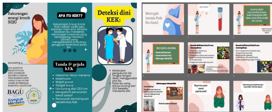
Gambar 1. Contoh leaflet dan powerpoint anemia dan deteksi dini KEK.

Kegiatan pengabdian masyarakat ini dilaksanakan di Aula kantor Desa Beleka, Kecamatan Gerung, Kabupaten Lombok Barat. Sasaran dalam kegiatan pengabdian ini adalah Ibu hamil sebanyak 22 orang. Rangkaian kegiatan pengabdian ini meliputi: (1) melakukan survei lokasi pada hari pertama; (2) mengurus surat perizinan pada hari kedua; dan (3) pelaksanaan kegiatan dalam bentuk promosi kesehatan yang didahului dengan melakukan pretest, pemberian materi dan diakhiri dengan posttest dilaksanakan pada hari ketiga, seperti terlihat pada Gambar 2.