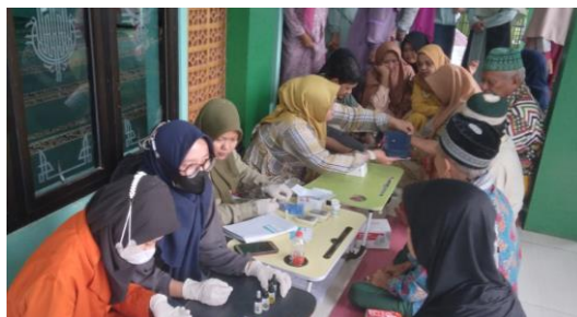
Gambar 2. Kegiatan Pemeriksaan Gula Darah Sewaktu

Pemeriksaan dimulai dengan sambutan pembukaan yang dilakukan oleh pihak Puskesmas, Selanjutnya melakukan pemeriksaan gula darah. Pemeriksaan gula darah sewaktu ini diawali dengan melakukan pencatatan data peserta, kemudian melakukan pemeriksaan dengan sampel darah kapiler dan pengukuran dilakukan menggunakan alat POCT glukometer Easy Touch . Hasil pemeriksaan dicatat pada lembar data serta formulir hasil yang diberikan kepada setiap peserta. Data hasil pemeriksaan selain digunakan untuk menyusun laporan diserahkan juga kepada Puskesmas yang dapat disimpan sebagai data pemeriksaan PTM warga masyarakat di wilayahnya. Data tersebut juga bisa digunakan sebagai dasar pembinaan dan penyuluhan kesehatan oleh puskesmas, untuk warga terutama yang kadar gulanya tinggi supaya mereka dapat melakukan pengobatan dan pencegahan komplikasi. Pelaksanaan kegiatan pemeriksaan gula darah sewaktu telah didokumentasikan seperti yang terlihat pada Gambar 2.