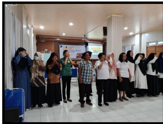
Gambar 2. Fasilitator dan peserta memperagakan konsep menghargai perbedaan pada pendidikan inklusif

bahkan ditingkat sekolah dasar oleh karena itu, muatan materi Pelatihan ini sangat diminati oleh peserta, seperti terlihat pada Gambar 2.