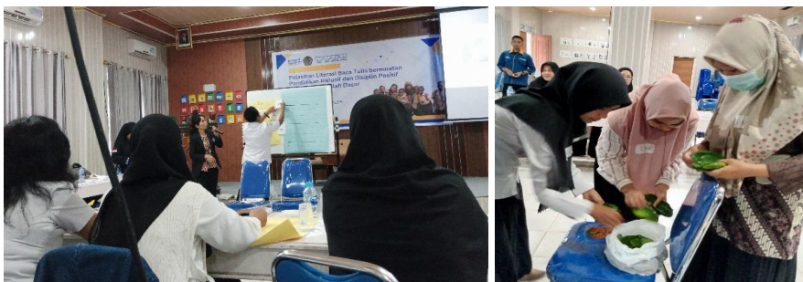
Gambar 3. Peserta mendemonstrasikan metode keterampilan literasi

Gambar 3 menunjukkan bahwa gambar sebelah kiri, peserta mendemonstrasikan keterampilan fonologi dan gambar sebelah kanan, peserta memilih media kontekstual seperti daun untuk memperagakan beberapa keterampilan pengajaran literasi yakni menggabungkan kata, memisah kata, menggolongkan kata pada konsep Kata, Suku Kata,