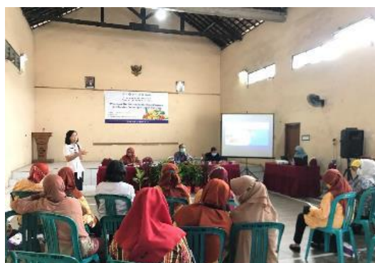
Gambar 3. Pemberian Materi dari Puskesmas Tlogosari Wetan

Kegiatan selanjutnya yaitu penyampaian materi. Pemberian materi dilakukan dengan metode ceramah dan brainstorming . Materi Manfaat Berpuasa Ramadan dan Pengaturan Konsumsi Obat selama Ramadan disampaikan oleh Kepala UPTD Puskesmas Tlogosari Wetan Kota Semarang sebagai materi pembuka, seperti terlihat pada Gambar 3.