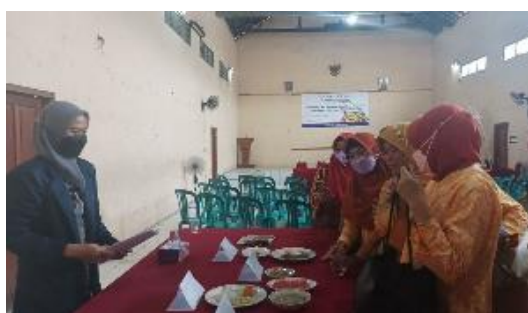
Gambar 5. Demonstrasi Menu Makan selama Puasa Ramadan

Kegiatan dilanjutkan dengan demonstrasi menu makan selama berpuasa Ramadan. Menu yang disajikan adalah sajian takjil, menu berbuka puasa, snack dan menu sahur, seperti terlihat pada Gambar 5.