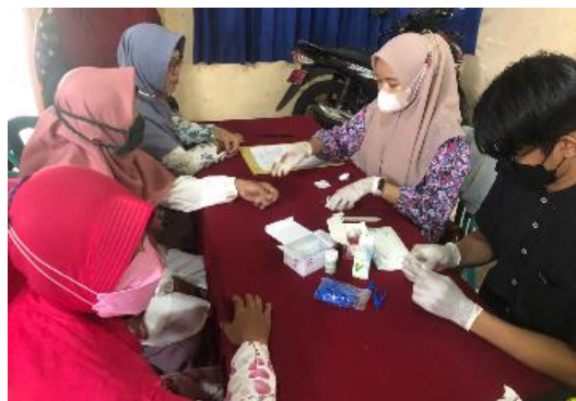
Gambar 2. Pemeriksaan Kadar Glukosa Darah Sewaktu (GDS)

Acara inti kegiatan pengabdian kepada Masyarakat ini diawali dengan pre-test . Pre-test pengetahuan menggunakan kuesioner yang terdiri dari 10 pertanyaan. Pertanyaan-pertanyaan tersebut mencakup program upaya pengendalian DM dari faktor gizi pada saat puasa, upaya pengendalian DM dari faktor perilaku, faktor risiko DM, dan batas ambang kadar glukosa darah dalam tubuh. Kegiatan selanjutnya berupa pengukuran kadar glukosa darah sewaktu yang dibantu oleh mahasiswa pengabdian dari Tim Analisis Kesehatan seperti terlihat pada Gambar 2.