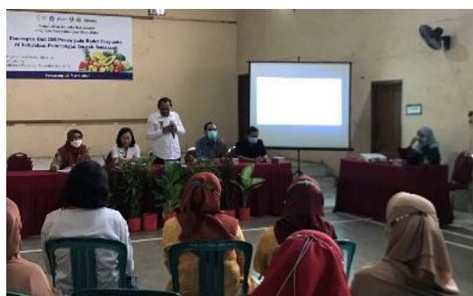
Gambar 1. Pembukaan Resmi Kegiatan Pengabdian kepada Masyarakat

Kegiatan pengabdian kepada masyarakat dilaksanakan dengan peserta bertempat di Aula kelurahan pedurungan tengah pada tanggal 15 Maret 2023. Kegiatan ini melibatkan dosen dari Jurusan Gizi Poltekkes Kemenkes Semarang, mahasiswa, Kepala UPTD Puskesmas Tlogosari Wetan dan Kelurahan Pedurungan Tengah. Kegiatan diawali dengan pembacaan Laporan Ketua Pengabdian dilanjutkan dengan Sambutan Ketua Tim Pengabdian dan Sambutan Lurah Pedurungan Tengah sekaligus membuka acara, seperti terlihat pada Gambar 1.