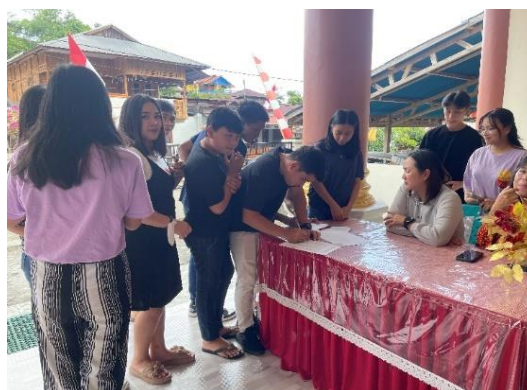
Gambar 2. Registrasi Peserta

Kegiatan PkM ini dilakukan oleh Fakultas Keperawatan UPH bekerjasama dengan pemerintah Kabupaten Minahasa Selatan untuk mendukung ASEAN Matters: Epicentrum of Growth sebagai program lanjutan prioritas Presidensi G20 Indonesia dimana Provinsi Sulawesi utara merupakan salah satu daerah prioritas dalam peningkatan kualitas sumber daya manusia. Oleh karena itu, yang menjadi target pada pemberian edukasi kesehatan bahaya mengkonsumsi miras dan napza adalah remaja yang berdomisili di Desa Suluuan, Kab. Minahasa Selatan yang di sadari tim sebagai generasi penerus bangsa. Pada pelaksanaan kegiatan ini di ikuti oleh 103 remaja dengan susunan kegiatan dimulai dari registrasi, proses registrasi dilakukan 30 menit sebelum acara dimulai dengan proses registrasi dapat dilihat pada Gambar 2.