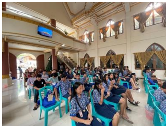
Gambar 4. Pelaksanaan Kegiatan PkM

Metode pelaksanaan PkM dalam bentuk sosialisasi dan diskusi oleh TIM BNNP dan Tim PKM FoN UPH dirasakan efektif bagi remaja dalam membenteng generasi penerus bangsa terhindar dari bahaya pengalagunaan narkoba dan miras hal ini dapat dilihat dari antusias remaja dalam mengikuti kegiatan (Gambar 4). Hal ini sejalan dengan hasil PkM oleh Nurdiansyah et al. (2022), Fahrezi et al. (2023) dan Picauly et al. (2022) yang mangatakan metode ini efektif dalam meningkatkan pengetahuan remaja terhadap bahaya Miras dan Napza bagi Kesehatan dirinya.