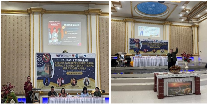
Gambar 3. Penyuluhan Bahaya Mengkonsumsi Miras Dan Napza

Metode pelaksanaan PkM dalam bentuk sosialisasi dan diskusi oleh TIM BNNP dan Tim PKM FoN UPH dirasakan efektif bagi remaja dalam membenteng generasi penerus bangsa terhindar dari bahaya pengalagunaan narkoba dan miras hal ini dapat dilihat dari antusias remaja dalam mengikuti kegiatan (Gambar 4). Hal ini sejalan dengan hasil PkM oleh Nurdiansyah et al. (2022), Fahrezi et al. (2023) dan Picauly et al. (2022) yang mangatakan metode ini efektif dalam meningkatkan pengetahuan remaja terhadap bahaya Miras dan Napza bagi Kesehatan dirinya.