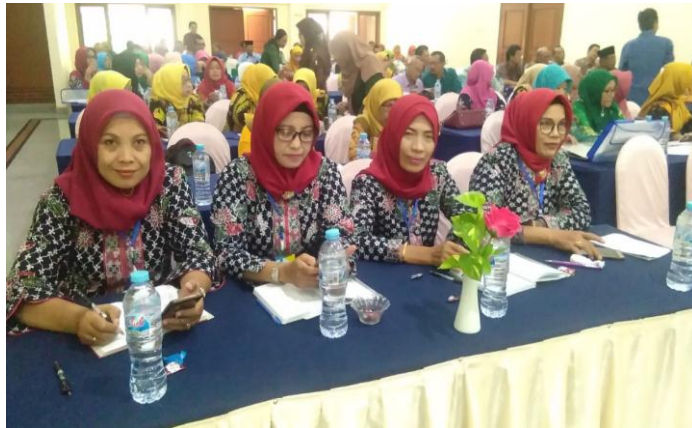
Gambar 5. Para guru SD kecamatan Glagah dan Turi yang menjadi peserta

meliputi pembuatan akun Google Classroom , cara membuka kelas dan membuat kode kelas, menambahkan materi , membuat quiz atau tugas serta cara penilaian.