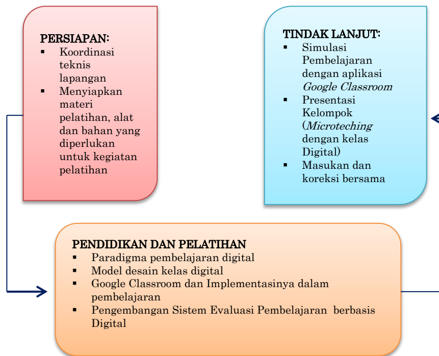
Gambar 1. Diagram Alir Pelatihan Pengembangan Kelas Digital