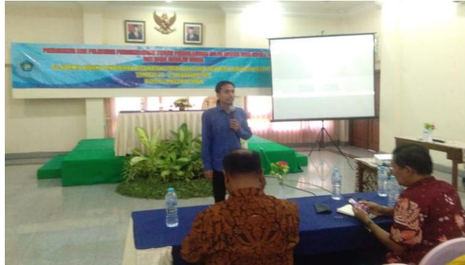
Gambar 2. Penyampaian materi pengantar

Instagram, Schoology , LMS Seamolec , dan Ruang Guru. Masing-masing aplikasi memiliki kelebihan dan kekurangan tersendiri. Google Classroom merupakan salah satu aplikasi virtual class yang dapat dimanfaatkan oleh guru sebagai media pembelajaran digital. Penggunaan google classroom tidak membutuhkan proses instalasi khusus, sehingga lebih sederhana, mudah dipahami dan digunakan.