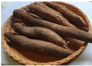
Tahap 1: Siapkan Singkong