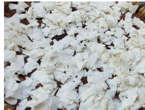
Tahap 5 : Iris Singkong