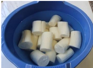
Tahap 4: Cuci Singkong