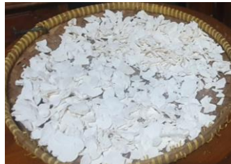
Tahap 7 : Singkong Setelah Dijemur