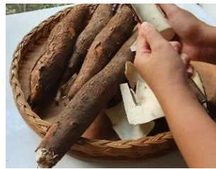
Tahap 2: Pengupasan Singkong