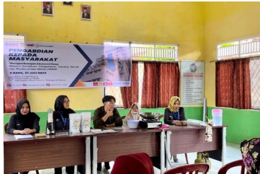
Gambar 1. Sosialisasi Tepung Mocaf

olahan makanan yang dapat dibuat dari bahan tepung mocaf. Kegiatan sosialisasi tepung mocaf seperti terlihat pada Gambar 1.