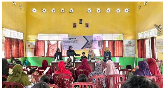
Gambar 2. Pelaksanaan Demonstrasi Kegiatan Pembuatan Tepung Mocaf

Pada kegiatan ini diawali dengan memberikan brosur terkait tahapan membuat tepung mocaf kepada peserta sehingga peserta dapat fokus mengamati demonstrasi pembuatan tepung mocaf tanpa perlu mencatat atau khawatir lupa terkait urutan tahapan tersebut. Setelah pembagian brosur terkait alat dan bahan yang dibutuhkan dan tahapan pembuatan tepung mocaf, langkah selanjutnya melakukan demonstrasi proses pembuatan tepung mocaf yang diawali dengan menampilkan bahan dan alat yang dibutuhkan dan mempraktekkan tahapan demi tahapan dalam membuat tepung mocaf. Berikut gambar tim pelaksana yang sedang melakukan demonstrasi, kegiatan tersebut seperti terlihat pada Gambar 2.