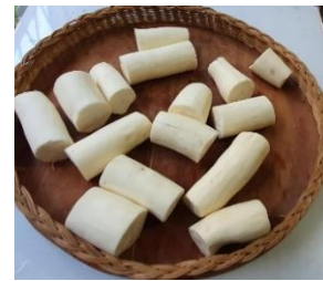
Tahap 3: Singkong Setelah Dikupas