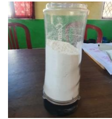
Tahap 8: Blender Singkong