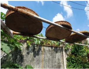
Tahap 6 : Penjemuran