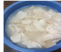
Tahap 6: Singkong Direndam