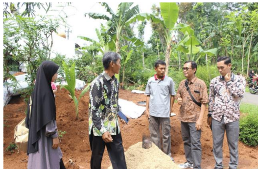
Gambar 3. Mengunjungi lokasi pembibitan

Pada tahap ini tim pengabdian menyusun rencana kegiatan sebagai solusi atas permasalahan yang berhasil diidentifikasi pada tahap sebelumnya. Solusi atas permasalahan dengan membangunkan aplikasi e-commerce berbasis website dan memberikan pendampingan dan pelatihan dengan metode workshop pada pengurus supaya dapat memanfaatkan aplikasi dengan baik. Untuk mendukung pembuatan website e-commerce maka tim pengabdian melaksanakan serangkaian kegiatan dengan menganalisa kebutuhan mitra dan mengumpulkan bahan untuk foto produk yang akan ditampilkan pada website. Gambar 3, merupakan rangkaian kegiatan pada tahap ini.