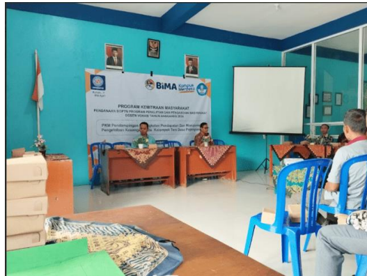
Gambar 4. Dokumentasi Pelatihan dan Workshop Aplikasi e-commerce

tanggal 20 April 2024. Pada kegiatan ini juga mengundang nara sumber dari koordinator penyuluh pertanian dan kepala desa setempat.