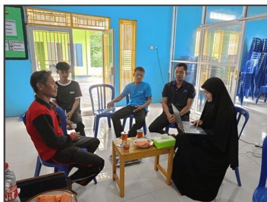
Gambar 2. Tahap Pendekatan Mitra

Pada tahap ini tim pengabdian melakukan survei lokasi dan pendekatan terhadap mitra. Pada tahap ini tim pengabdian masyarakat juga melakukan observasi dan wawancara untuk mengidentifikasi situasi mitra dan permasalahan yang dihadapi mitra. Pada Gambar 2 merupakan dokumentasi pada saat wawancara dengan Sebagian pengurus kelompok tani dan dilaksanakan di Kantor Balai Desa Pejengkolan tanggal 19 Maret 2024.