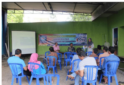
Gambar 5. Pelatihan dan seminar strategi pemasaran

Pelatihan ini dimulai dengan sambutan dari ketua kelompok tani dan kepala desa, kemudian ketua pengusul membuka acara dengan menyampaikan program kerja dan memberikan angket pre test. Hasil dari pre test diperoleh kesimpulan bahwa hanya 25% dari total peserta yang sudah mengenal aplikasi e-commerce . Adapun aplikasi e-commerce yang peserta kenal adalah shopee dan tokopedia. Meski begitu peserta yang sebagian besar belum memahami bagaimana menggunakan dan memanfaatkan e-commerce . Pada tahap ini tim pengabdian mulai melaksanakan workshop aplikasi e commerce tanibahagia.web.id kepada mitra kelompok tani. Kegiatan dilanjutkan pada hari berikutnya dengan memberikan pelatihan lanjutan dan seminar strategi pemasaran dan manajemen bisnis. Gambar 5 merupakan dokumentasi pada saat pelatihan dilaksanakan.