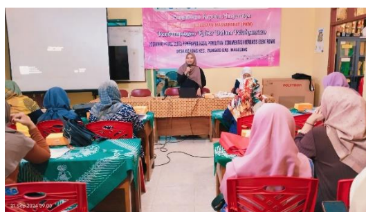
Gambar 2. Tim Pengabmas dan Kader Posyandu Desa Bojong Kecamatan Mungkid Kabupaten Magelang

Kegiatan pengabdian masyarakat “Pendampingan Kader dalam Pelaksanaan Posyandu Prima serta Penerapan Hasil Penelitian Dokumentasi Berbasis Elektronik” berusaha memberikan pemahaman kepada kader posyandu tentang pelayanan yang harus diberikan pada masyarakat saat kegiatan posyandu prima. Kader posyandu diberikan pemahaman tentang berbagai pemeriksaan dan data yang harus diambil pada saat kegiatan pelayanan posyandu prima. Kader diberikan buku pegangan untuk mempermudah proses belajar. Buku “Posyandu Prima; Upaya sehat untuk semua” berisikan materi yang mudah dipahami oleh kader sehingga dapat menjadi panduan dalam pemberian pelayanan. Buku “Posyandu Prima; Upaya Sehat untuk Semua” telah ber ISBN no. 978-623-432-219-4 (cetak); 978-623-432-220-0 (e-book) dan telah memperoleh sertifikat Hak Cipta No EC00202498670/ 000673871.