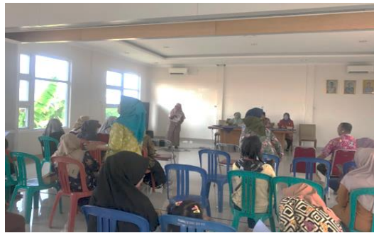
Gambar 1. Pengisian Pre Test oleh Peserta