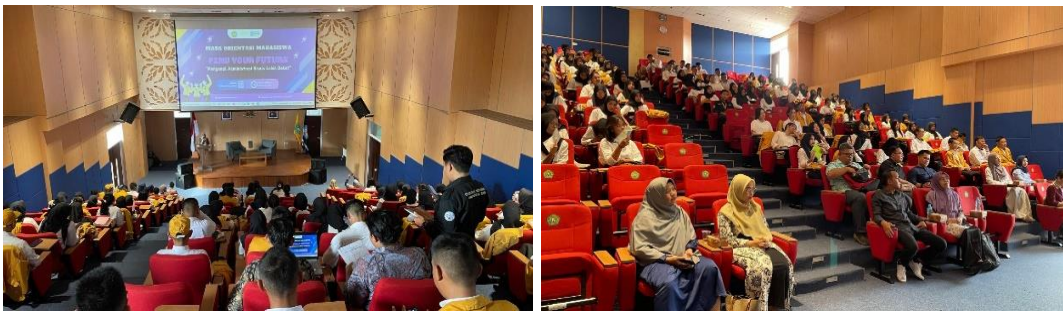
Gambar 2. Penyampaian materi tentang akademik, etika, PKM, dan MBKM

Kegiatan terakhir sebelum penutup adalah, penyampaian dari himpunan mahasiswa untuk mengajak mahasiswa baru terlibat dalam organisasi kampus, mahasiswa diberi pemahaman tentang pentingnya keterlibatan dalam organisasi kemahasiswaan untuk mengembangkan kemampuan sosial dan kepemimpinan. Ketua Himpunan Mahasiswa Administrasi Bisnis (HIMABISNIS) yang akan mempresentasikan berbagai kegiatan yang dapat diikuti mahasiswa untuk menunjang perkembangan diri mereka. Presentasi ini juga akan mencakup manfaat membangun jaringan sosial dan profesional selama kuliah. Setelah seluruh sesi selesai, kegiatan orientasi akan diakhiri dengan sesi tanya jawab dan penutupan, di mana mahasiswa dapat mengajukan pertanyaan terkait materi yang telah disampaikan. Sesi ini memberikan kesempatan bagi mahasiswa untuk mengklarifikasi hal-hal yang belum dipahami dan memperoleh informasi lebih lanjut sebelum kegiatan berakhir. Kegiatan ini berjalan dengan lancar dan diakhiri dengan penutup dengan dipandu oleh MC.