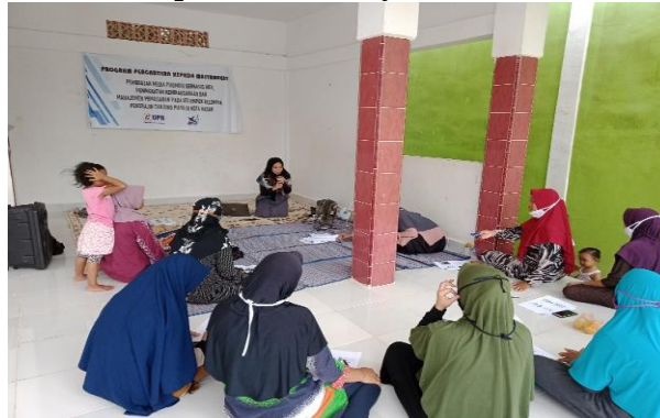
Gambar 4. Pelaksanaan pre test dan post test

Metode yang digunakan dalam mengevaluasi dampak ekonomi dan sosial dari kegiatan PKM menggunakan pengukuran kuantitatif (Gambar 4). Alat ukur ini digunakan untuk melihat perbandingan kondisi kelompok pengrajin sebelum dan sesudah diadakannya kegiatan pengabdian ini. Dan pendekatan yang digunakan adalah pendekatan pre test dan post test (Raymond, 2019).