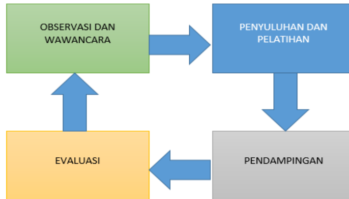
Gambar 1. Model pelaksanaan

Dengan adanya kegiatan pengabdian ini adalah untuk memberikan solusi terkait kendala yang dihadapi oleh mitra. Adapun pendekatan yang diberikan bagi realisasi pelaksanaan program PKM ini adalah dengan menerapkan model pemberdayaan dengan proses sebagai berikut: