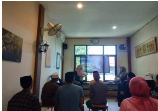
Gambar 1. Kegiatan PKM

Kegiatan ini dibantu oleh mahasiswa yang sedang melaksanakan KKN di kelurahan Sidosermo (Gambar 1). Pembentukan kelompok belajar ini dilaksanakan secara terbimbing oleh mahasiswa. Pelibatan orang tua anak dan karang taruna juga dimaksimalakan dalam kegiatan ini. Salah satu tujuannya untuk agar terdapat keberlanjutan kegiatan kelompok belajar anak di Kelurahan Sidosermo. (Astuti et al. , 2018) Setelah selesai kegiatan ini, maka kegiatan belajar dengan memaksimalkan teknologi informasi tetap berlanjut dengan pembimbingan orang tua dan karang taruna di kelurahan sidosermo.