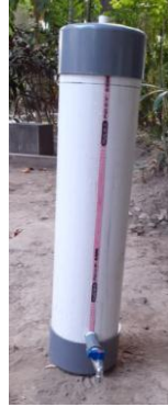
Gambar 3. Alat Filtrasi Air Berbasis Komposit

Pada tahap pembuatan, desain alat (gambar 1) diadopsi untuk membuat alat filtrasi yang dapat dimanfaatkan oleh warga desa. Tahapan dalam membuat alat filtrasi yaitu memotong paralon sesuai ukuran dan meletakkan bahan-bahan alam sesuai dengan desain Gambar 3.