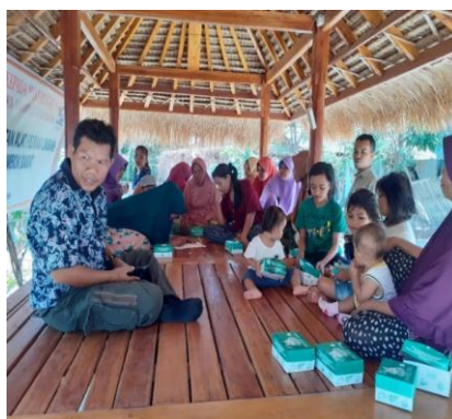
Gambar 2. Kegiatan sosialisasi prototipe alat filtrasi

Pengabdian pada masyarakat dengan judul Implementasi Teknologi Filtrasi Air dengan Komposit dari Karbon Aktif dan Calcium Oxide Untuk Meningkatkan Kualitas Air dilaksanakan pada tanggal 28 September 2019. Jumlah peserta pelatihan ini adalah 30 orang. Khalayak sasaran dalam kegiatan pengabdian pada masyarakat memiliki antusiasme dan dukungan yang tinggi. Hal ini terlihat dari dukungan berupa ketersediaan tempat dan fasilitas penunjang demi kelancaran kegiatan.