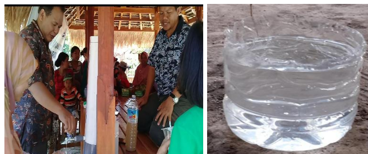
Gambar 4. Simulasi uji coba penjernihan air dengan alat filtrasi berbasis komposit

Setiap tahapan pembuatan alat filtrasi diikuti dengan antusias oleh warga. Banyak dari mereka yang tidak menduga bahwa bahan-bahan yang biasa dibuang ini dapat mereka manfaatkan sebagai penjernih air. Pada tahapan selanjutnya yaitu masyarakat menguji coba alat yang sudah dibuat. Alat diuji coba menggunakan air sumur desa sekitar yang keruh dan berbau. Dengan kata lain, air ini tidak layak untuk dipakai oleh masyarakat baik untuk dikonsumsi maupun untuk bercocok tanam. Air sumur dimasukkan kedalam alat filtrasi menghasilkan air yang jernih dan tidak berbau.