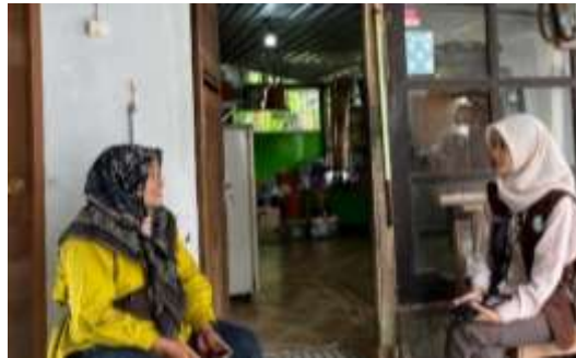
Gambar 2. Observasi dan Wawancara pada Mitra UMKM

pencatatan keuangan. Hasil survei dan observasi tersebut menjadi dasar dalam menentukan fokus permasalahan serta menyusun strategi pendampingan yang sesuai dengan kebutuhan mitra UMKM. Rangkaian kegiatan pada tahap persiapan ini ditunjukkan pada Gambar 2.