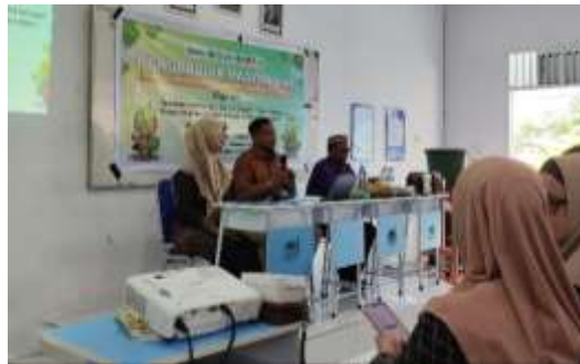
Gambar 1. Edukasi Ekonomi Sirkular dan Sanitasi

Kegiatan inti dilaksanakan dalam satu rangkaian workshop partisipatif yang melibatkan 53 siswa. Tahap ini diawali dengan pembukaan resmi dan pemberian pre-test untuk memotret pengetahuan awal peserta. Sesi pertama adalah pemberian materi edukatif mengenai peluang dan tantangan ekonomi sirkular. Siswa diberikan pemahaman mendalam tentang bagaimana mengubah paradigma "buang sampah" menjadi "pemanfaatan limbah" melalui teknik upcycling . Untuk mendukung pemahaman visual, tim membagikan leaflet informatif yang merinci langkah-langkah pembuatan Ecosink (Gambar 1).