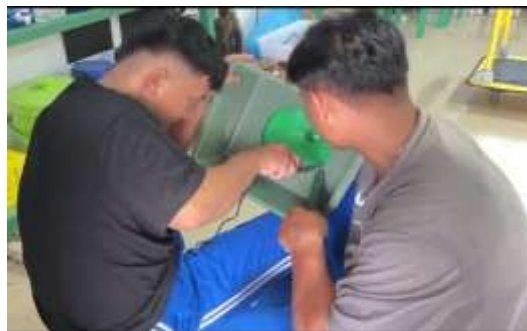
Gambar 2. Praktik Pembuatan Ecosink

Melalui praktik langsung ini, siswa berhasil merakit unit Ecosink yang fungsional. Air yang keluar dari sistem filtrasi terbukti lebih jernih dan aman untuk dibuang ke saluran drainase atau dimanfaatkan kembali untuk menyiram tanaman, mendukung prinsip konservasi air.