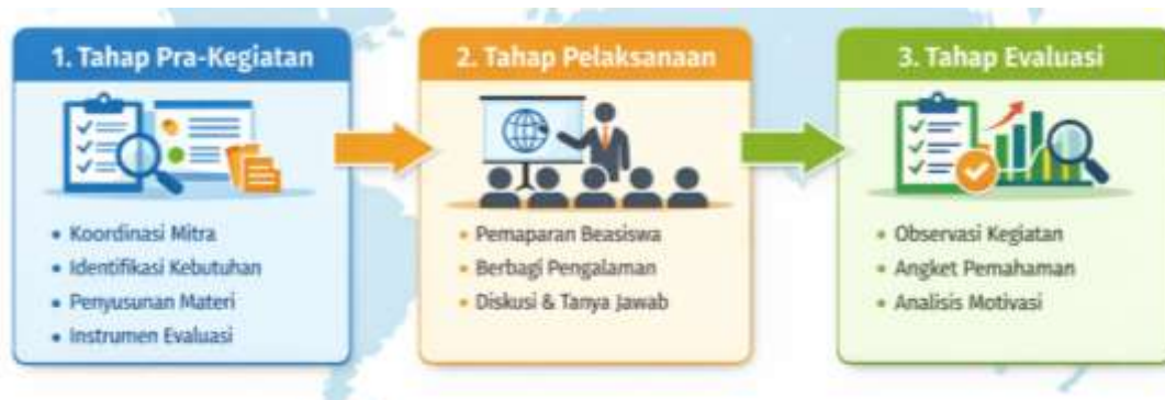
Gambar 1. Tahapan Kegiatan Pengabdian Masyarakat

ini melibatkan 30 peserta yang kebanyakan dari program studi tadriss Bahasa Inggris yang ditetapkan secara pasti oleh pihak mitra untuk menjaga konsistensi data. Adapun tahap pelaksanaan kegiatan bisa dilihat pada Gambar 1 berikut.