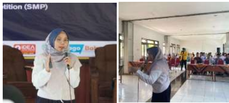
Gambar 3. Pemateri sedang menjelaskan presentasi tentang beasiswa

Hasil yang didapatkan dari tahap ini adalah peserta menunjukkan antusias lebih tinggi melalui diskusi interaktif dan pertanyaan yang berkaitan tentang beasiswa.