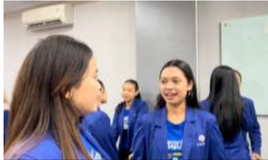
Gambar 2. Antusiasme Peserta Saat Praktik Roleplay Menggunakan “30-Second Formula”

Antusiasme memuncak pada sesi simulasi “ The Arena ”. Peserta berpasangan mempraktikkan materi dalam skenario simulasi wawancara. Observasi lapangan menunjukkan perubahan atmosfer yang drastis; lingkungan belajar yang aman ( safe space ) membuat peserta yang awalnya pasif menjadi berani tampil. (Dokumentasi kegiatan tersaji pada Gambar 2).