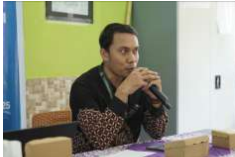
Gambar 1. Penyampaian Materi Pengelolaan Keuangan Koperasi Desa

Peserta diminta untuk menjelaskan potensi desa yang dapat menjadi kekuatan dalam membangun koperasi. Potensi-potensi yang telah digali oleh masing-masing kelompok baik berupa SDM dan SDA dikumpulkan untuk menjadi catatan arah pengembangan koperasi kedepannya. Tujuan dari sesi ini agar seluruh peserta mengetahui potensi dari desa yang bermanfaat pada pengembangan koperasi desa merah putih. Sesi ini berlangsung dengan pemateri menguraikan tentang berbagai keterampilan yang sebaiknya dikuasai oleh para pengurus koperasi dan anggota koperasi. Pemateri memaparkan kaitan antara kemampuan mengelola keuangan yang baik dan pengaruhnya terhadap kesuksesan operasional sebuah koperasi, seperti terlihat pada Gambar 1.