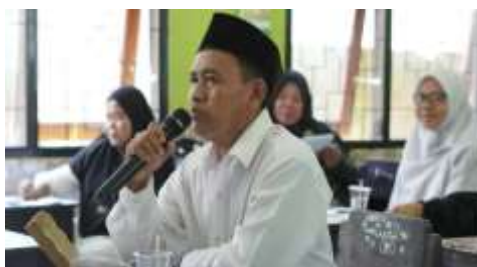
Gambar 2. Diskusi Pengelolaan Keuangan Koperasi Desa

Kegiatan diskusi bertujuan untuk mempertajam pemahaman para peserta pengabdian terhadap materi yang disampaikan oleh pemateri. Selain itu sesi diskusi diharapkan mampu menjadi tempat untuk menyelesaikan masalah yang selama ini dihadapi oleh pengurus koperasi merah putih. Diskusi berlangsung secara dua arah antara peserta dan pemateri, tanya-jawab berlangsung dengan mengalir sesuai dengan kasus atau masalah yang dihadapi pengurus koperasi dan juga berbagai hal yang dianggap membingungkan dalam mengelola koperasi desa merah-putih, seperti terlihat pada Gambar 2.