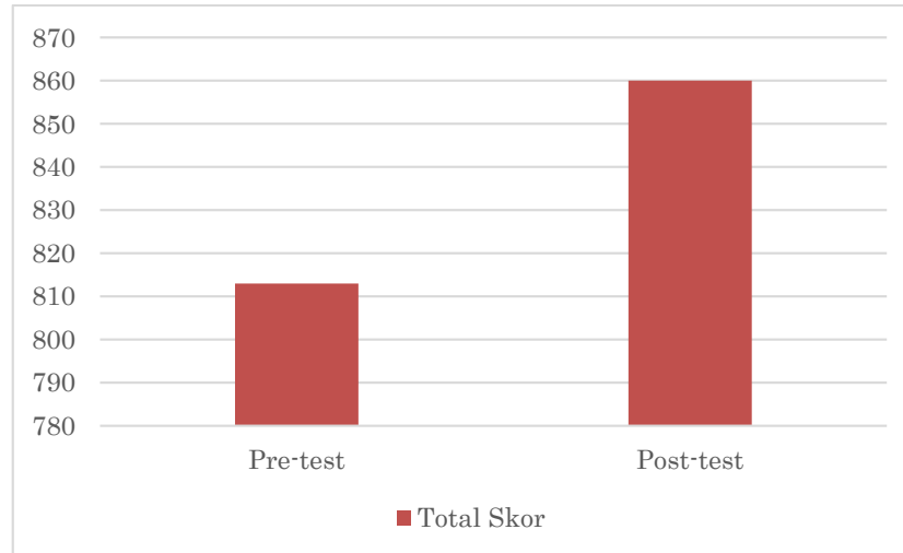
Gambar 4. Hasil total skor Pre-test dan post-test

Berdasarkan hasil yang ditunjukkan, temuan utama menunjukkan peningkatan skor yang cukup baik pada aspek resiliensi khususnya kemampuan untuk mulai belajar bangkit lagi saat gagal aitem 5 dan 8 merasa senang punya keterampilan baru. Penilaian diri yang negative masih ada pada diri remaja yang ditunjukkan pada aitem takut dan sulit menceritakan diri dengan lebih baik. Kegiatan jurnaling diharapkan menjadi salah satu cara yang bisa membantu remaja Lembaga Pembinaan Khusus Anak untuk belajar menceritakan dan mengungkapkan secara lebih