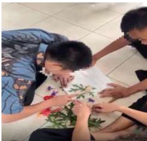
Gambar 2. Kegiatan hari kedua dilakukan dengan soft skill ecoprint tote bag

Kegiatan hari kedua yaitu workshop ecoprint totebag yang memiliki tujuan untuk melatih soft-skill dan sebagai sarana untuk anak binaan belajar kontrol emosi, kerjasama, kreativitas, melatih kemandirian, menambah keterampilan dan pengetahuan, sehingga setelah keluar dari LPKA diharapkan memiliki bekal pengetahuan dan keterampilan yang memadai. Saat pelaksanaan pada 30 remaja dibagi dalam 10 kelompok dan masing-masing kelompok terdiri dari 3 remaja. Dari 30 peserta yang hadir terlibat secara aktif dan kooperatif terutama saat pelaksanaan ecoprint terlihat antusias, Kerjasama dan berdiskusi untuk hasil karya dan kreatifitas yang baik. Setelah semua kelompok menyelesaikan semua karya tas ecoprint , dilanjutkan penilaian oleh tim penyelenggara kegiatan untuk diberikan reward karya terbaik 1, 2 dan 3, seperti terlihat pada Gambar 2.