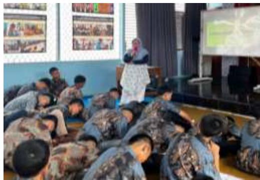
Gambar 1. Kegiatan hari pertama dilakukan dengan Psikoedukasi dan jurnaling pada anak binaan dengan materi perubahan positif dan penguatan moral

Kegiatan hari kedua yaitu workshop ecoprint totebag yang memiliki tujuan untuk melatih soft-skill dan sebagai sarana untuk anak binaan belajar kontrol emosi, kerjasama, kreativitas, melatih kemandirian, menambah keterampilan dan pengetahuan, sehingga setelah keluar dari LPKA diharapkan memiliki bekal pengetahuan dan keterampilan yang memadai. Saat pelaksanaan pada 30 remaja dibagi dalam 10 kelompok dan masing-masing kelompok terdiri dari 3 remaja. Dari 30 peserta yang hadir terlibat secara aktif dan kooperatif terutama saat pelaksanaan ecoprint terlihat antusias, Kerjasama dan berdiskusi untuk hasil karya dan kreatifitas yang baik. Setelah semua kelompok menyelesaikan semua karya tas ecoprint , dilanjutkan penilaian oleh tim penyelenggara kegiatan untuk diberikan reward karya terbaik 1, 2 dan 3, seperti terlihat pada Gambar 2.