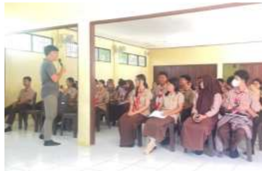
Gambar 1. Kegiatan Sosialisasi

Pelaksanaan kegiatan sosialisasi dilaksanakan di ruang kelas yang telah disediakan oleh pihak sekolah. Sebanyak 40 siswa terlibat sebagai peserta kegiatan. Kegiatan dibuka dengan pengantar dari perwakilan sekolah, kemudian dilanjutkan dengan penyampaian materi oleh tim dosen pengabdian. Materi yang disampaikan meliputi pengertian pergaulan bebas, bentuk-bentuk perilaku menyimpang, faktor penyebab, serta dampak negatif terhadap masa depan remaja. Penyampaian dilakukan secara komunikatif dengan menggunakan media presentasi dan pendekatan diskusi terbuka, seperti terlihat pada Gambar 1.