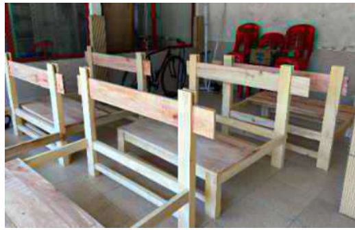
Gambar 4. ATBM sebagai Sarana Produksi Songket