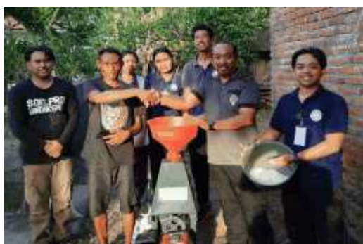
Gambar 3. Pemanfaatan Rice Milling Machine oleh Kelompok Tani

Untuk meningkatkan nilai tambah hasil pertanian, program menginstalasi satu unit rice milling machine portabel (7,5 HP) yang memungkinkan petani mengolah gabah kering panen menjadi beras secara mandiri. Pemanfaatan mesin ini menurunkan ketergantungan pada jasa penggilingan luar desa dan meningkatkan nilai ekonomi hasil panen. Berdasarkan pencatatan kelompok tani, nilai tambah ekonomi meningkat sekitar 20–25% karena produk dijual dalam bentuk beras siap konsumsi, seperti terlihat pada Gambar 3.