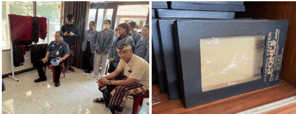
Gambar 5. Outlet Pemasaran Produk Songket Jinengdalem