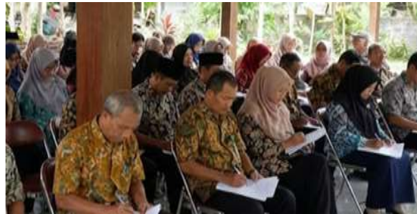
Gambar 4. Suasana Pelaksanaan Pre-test oleh Peserta Sosialisasi

antara IMB (Izin Mendirikan Bangunan) lama dengan PBG (Persetujuan Bangunan Gedung). Suasana ini mengonfirmasi hipotesis awal bahwa literasi tata ruang di tingkat akar rumput masih cukup rendah, seperti terlihat pada Gambar 4.