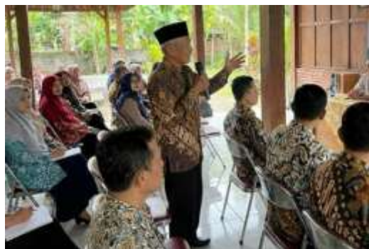
Gambar 3. Suasana Diskusi Interaktif Antara Warga dan Narasumber

Sesi ini menjadi puncak dari kegiatan sosialisasi. Dinamika yang terjadi sangat hidup, di mana peserta tidak hanya bertanya tetapi juga menyampaikan keluhan ( uneg-uneg ). Beberapa isu nyata yang muncul antara lain terkait status tanah waris yang belum dipecah sertifikatnya namun ingin dibangun rumah anak-anaknya, serta kekhawatiran mengenai bangunan lama yang sudah berdiri puluhan tahun tanpa IMB apakah akan dikenakan sanksi atau tidak. Narasumber dan Mitra DPTR secara bergantian memberikan jawaban solutif, menjelaskan bahwa hukum tidak berlaku surut untuk kasus tertentu, namun tetap mendorong pemutihan atau legalisasi bangunan sesuai regulasi yang berlaku. Dialog ini berhasil mencairkan ketegangan antara masyarakat dengan regulator, seperti terlihat pada Gambar 3.