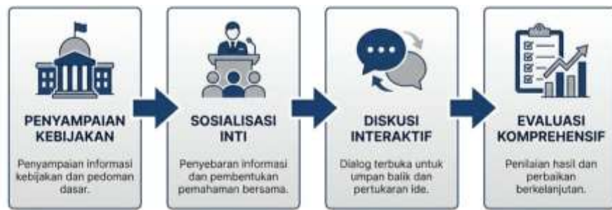
Gambar 1. Diagram Alur Tahapan Pelaksanaan Sosialisasi Pengendalian Pemanfaatan Ruang

partisipatif yang berulang dan saling berkaitan (Kemmis et al., 2014), seperti terlihat pada Gambar 1.