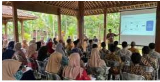
Gambar 2. Suasana Pemaparan Materi Teknis Perizinan Tata Ruang oleh Pengabdi selaku Narasumber