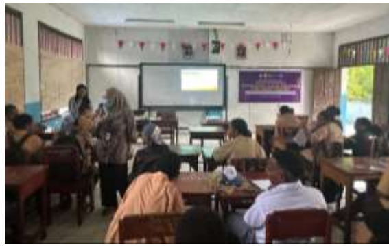
Gambar 2. Pemaparan Materi Tentang Bahaya Konsumsi Alkohol

Kegiatan penyuluhan yang disampaikan mencakup berbagai dampak negatif konsumsi alkohol yang dapat merusak kesehatan fisik dan mental, mengganggu kehidupan sosial, serta meningkatkan risiko terjadinya kecelakaan dan pelanggaran hukum. Melalui kegiatan ini, siswa-siswi diberikan pemahaman mengenai bahaya ketergantungan alkohol, penurunan fungsi otak, gangguan emosi, serta perubahan perilaku yang dapat muncul akibat konsumsi alkohol secara berlebihan.