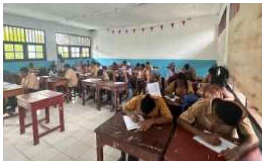
Gambar 3. Pengisian Kuesioner Post Test Kepada peserta

Penyuluhan ini juga bertujuan menumbuhkan kesadaran siswa akan pentingnya menjaga diri dari pengaruh buruk alkohol demi masa depan yang lebih sehat dan produktif. Selain itu, kegiatan ini diharapkan mampu menciptakan lingkungan sekolah yang sehat, aman, dan peduli terhadap perilaku hidup sehat, sehingga siswa-siswi dapat mengambil peran aktif dalam pencegahan konsumsi alkohol di lingkungan sekitarnya. Kemudian, Tahap ketiga kegiatan adalah pelaksanaan post-test yang diberikan kepada seluruh peserta setelah penyampaian materi penyuluhan selesai. Sebagaimana ditunjukkan pada gambar 3.