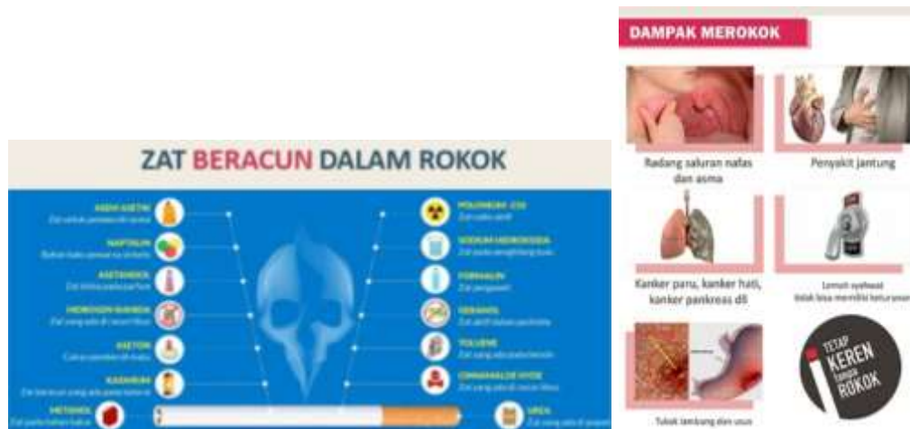
Gambar 1. Materi Penyuluhan

Berikut dokumentasi materi penyuluhan edukasi dampak negative rokok pada pelajar, seperti terlihat pada Gambar 1.