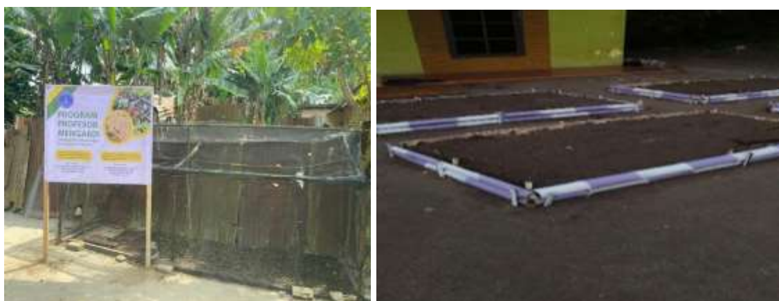
Gambar 3. Pelaksanaan Pelatihan 2

Pada kegiatan selanjutnya yakni dilakukan penyampaian materi terkait pemanfaatan Maggot untuk diolah menjadi Kasgot (bekas kotoran Maggot). Kasgot merupakan hasil dari media budidaya maggot dan termasuk bahan organik yang relatif baru untuk digunakan sebagai campuran media tanam dibandingkan kotoran hewan (Triwijayani et al., 2023). Pupuk organik dari kasgot ini nantinya akan menjadi media tanam untuk penanaman sayuran di pekarangan rumah pada kegiatan selanjutnya. Selain itu juga dilakukan pelatihan bagaimana membuat pakan ternak dari Maggot secara sederhana, seperti terlihat pada Gambar 3.