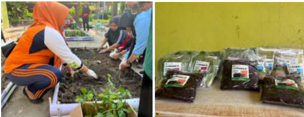
Gambar 4. Kegiatan Pelatihan 3

Selanjutnya pada hari berikutnya dengan jadwal yang sudah disepakati, dilakukan pendampingan terkait pemanfaatan pekarangan rumah untuk ditanami berbagai jenis sayuran dengan media pupuk organik dari kasgot (bekas kotoran Maggot). Pada kegiatan ini, Ibu-ibu PKK diberikan pelatihan bagaimana mendesign pekarangan secara sederhana untuk dijadikan lahan mini untuk ditanami berbagai macam sayuran hortikultura. Selain itu Ibu-ibu PKK juga diberikan 1 paket budidaya Maggot dan benih berbagai macam sayuran. Harapannya kegiatan ini bisa dilakukan oleh mitra secara berkelanjutan sehingga kebutuhan pangan keluarga berupa sayuran dapat terpenuhi dan diharapkan nantinya akan menjadi produk unggulan dari Ibu-ibu PKK Desa Pantai Labu Baru. Pada kegiatan ini juga berikan brand produk yang telah dihasilkan yakni SAMARA (Sampah Maggot Sejahtera), seperti terlihat pada Gambar 4.