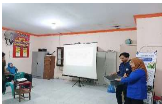
Gambar 2. Pelaksanaan Pelatihan 1

Pada kegiatan berikutnya yakni pelaksanaan pelatihan diawali dengan penyampaian materi mengenai pemanfaatan limbah rumah tangga yakni bagaimana pemilahan sampah organik dan anorganik, selain itu juga dipaparkan terkait manfaat Maggot atau larva Black Soldier Fly sebagai aktor dalam proses penguraian limbah menjadi pupuk organik. Pada kegiatan ini juga diberikan sample Maggot serta bagaimana cara membudidayakan Maggot. Sehingga harapannya ibu-ibu PKK Desa Pantai Labu Baru dapat membudidayakan Maggot di rumah sehingga pada kegiatan berikutnya, hasil budidaya Maggot nantinya dapat digunakan sebagai produk lanjutan dari kegiatan ini, seperti terlihat pada Gambar 2.