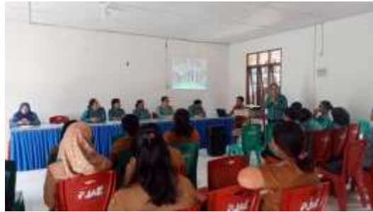
Gambar 2. Memberikan Penyuluhan Mencegah Stunting Melalui Edukasi Gizi dan Pendampingan Keluarga

rutin di Posyandu. Meningkatnya partisipasi masyarakat dalam kegiatan kesehatan seperti terlihat pada Gambar 2.