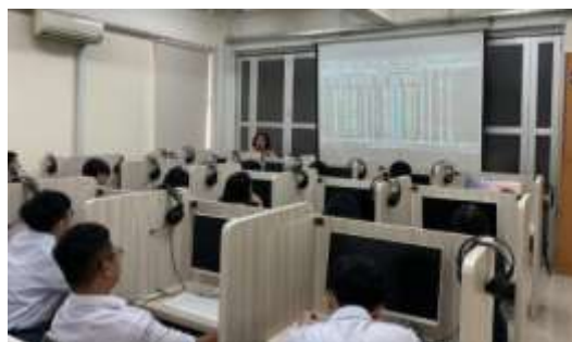
Gambar 2. Siswa belajar simulasi pasar modal dengan aplikasi KB ARA

Materi pelatihan ini juga bertujuan untuk menumbuhkan kebiasaan atau habit untuk menabung atau menyisihkan uang dalam jumlah kecil yang nantinya bisa ditingkatkan sesuai dengan kemampuan. Tujuan dari menabung ini adalah untuk membangun fondasi keuangan dan jika tabungan sudah tercukupi, tabungan dapat dikembangkan untuk investasi. Salah satunya adalah dengan berinvestasi di pasar modal. Investasi di pasar modal ini terjangkau karena bisa dimulai dengan nilai investasi sebesar Rp 100.000,- Ariani et al. (2024); Sahputra et al. (2020) sehingga terjangkau untuk siswa yang ingin membuka rekening saham. Adapun materi yang berkaitan dengan pasar modal dilakukan dengan menjelaskan tentang apa itu pasar modal, motivasi berinvestasi di pasar modal, dan penjelasan tentang instrumen yang diperdagangkan di pasar modal yang terdiri dari saham, obligasi, dan reksadana, seperti terlihat pada Gambar 2.