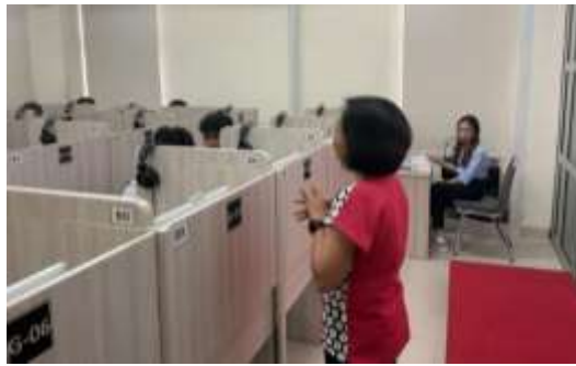
Gambar 1. Pelatihan Pasar Modal dengan Materi

Materi pelatihan ini juga bertujuan untuk menumbuhkan kebiasaan atau habit untuk menabung atau menyisihkan uang dalam jumlah kecil yang nantinya bisa ditingkatkan sesuai dengan kemampuan. Tujuan dari menabung ini adalah untuk membangun fondasi keuangan dan jika tabungan sudah tercukupi, tabungan dapat dikembangkan untuk investasi. Salah satunya adalah dengan berinvestasi di pasar modal. Investasi di pasar modal ini terjangkau karena bisa dimulai dengan nilai investasi sebesar Rp 100.000,- Ariani et al. (2024); Sahputra et al. (2020) sehingga terjangkau untuk siswa yang ingin membuka rekening saham. Adapun materi yang berkaitan dengan pasar modal dilakukan dengan menjelaskan tentang apa itu pasar modal, motivasi berinvestasi di pasar modal, dan penjelasan tentang instrumen yang diperdagangkan di pasar modal yang terdiri dari saham, obligasi, dan reksadana, seperti terlihat pada Gambar 2.