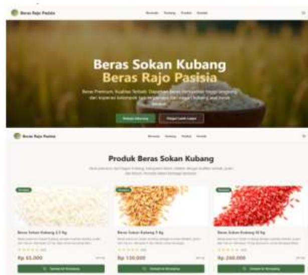
Gambar 2. Hasil Produk Pelaksanaan Kegiatan

Pelaksanaan pengabdian juga menghasilkan dalam bentuk produk branding barang dan website khusus pemasaran dan penjualan beras Cisokan Kubang, yang ditampilkan pada Gambar 2.