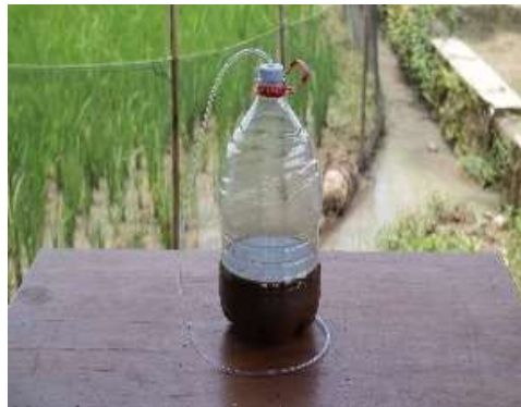
Gambar 2. Pupuk Organik Cair

campuran tercampur sempurna. Bahan-bahan pupuk organik cair dimasukkan ke dalam galon air mineral yang sudah diberi selang. Pupuk organik cair difermentasi selama 14 hari (Gambar 2).