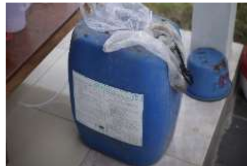
(b) Urin Sapi