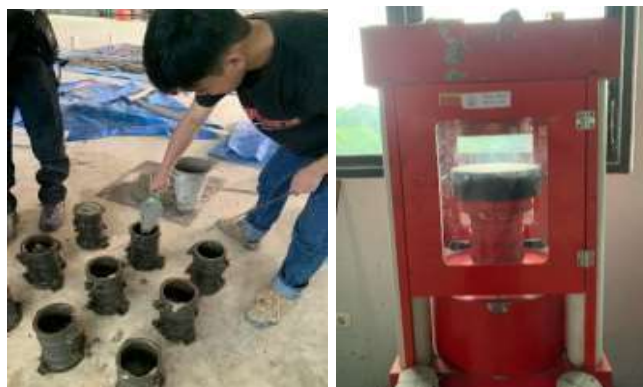
Gambar 4. Pengujian Mutu Kuat Tekan Beton