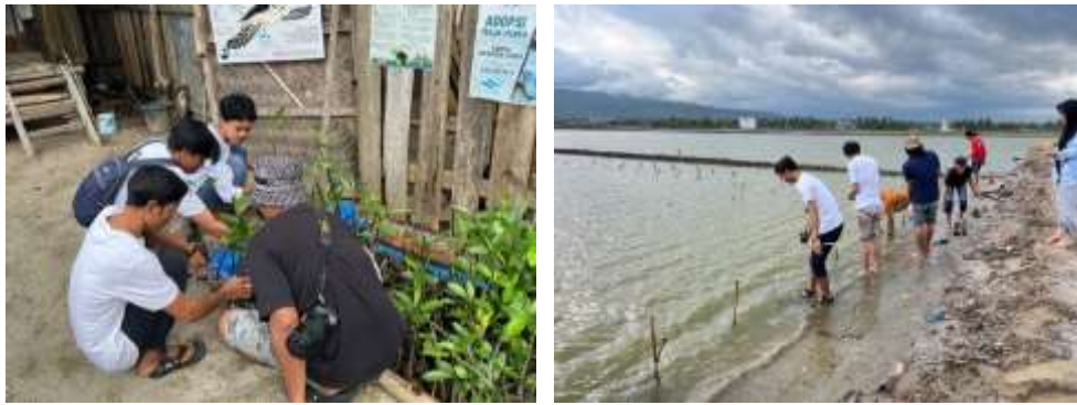
Gambar 2. Penanaman Mangrove