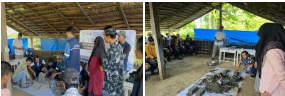
Gambar 3. Pelatihan dan Pendampingan Pembuatan Beton Sesuai SNI 7656:2012 dengan Bahan Tambah Sago Ash dan Cangkang Sawit