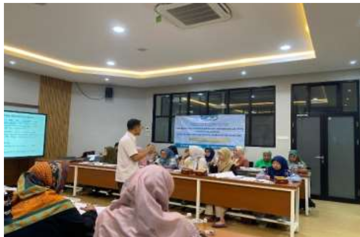
Gambar 1. Pemaparan Materi oleh Tim Abdimas

Kegiatan diawali dengan pengisian pre-test seluruh mitra, dengan tujuan untuk mengetahui pemahaman awal mengenai Pajak Penghasilan UMKM. Setelah itu, pemateri menyampaikan materi terkait perhitungan Pajak Penghasilan UMKM seperti yang dapat dilihat pada Gambar 1. Pemaparan materi dimulai dari penjelasan mengenai kategori UMKM sebagai dasar pengenaan pajak, kelompok UMKM berdasarkan perpajakan dan tarif pajaknya, jenis pajak yang harus dibayarkan UMKM, dasar dan rumus perhitungan Pajak Penghasilan (PPh) UMKM, dan cara menghitung pajak UMKM.