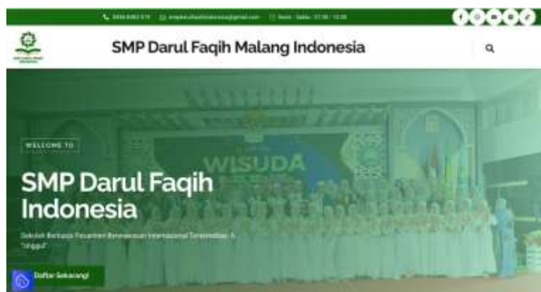
Gambar 4. Tampilan awal website lembaga sebagai luaran program

kelembagaan setelah proses pendampingan. Adapun tampilan awal website seperti terlihat pada Gambar 4.