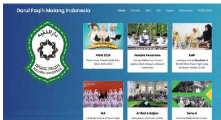
Gambar 3. Contoh hasil produk digital lembaga mitra

Ringkasan pada Tabel 2 memperlihatkan bahwa perubahan paling nyata terjadi pada penguatan identitas digital lembaga dan peningkatan kemampuan peserta dalam memanfaatkan teknologi untuk tata kelola dasar. Pada isi tabel tersebut menunjukkan bahwa program pendampingan memberikan perubahan yang cukup jelas pada aspek digitalisasi kelembagaan. Jumlah lembaga yang memiliki website aktif meningkat dari 5 menjadi 15 dari total 20 lembaga, sementara penggunaan email resmi atau website aktif sebagai identitas digital juga naik dari 4 menjadi 15 lembaga. Selain itu, pemahaman digital peserta yang pada awalnya belum merata dan masih dominan pada tingkat dasar mengalami peningkatan sekitar 60% berdasarkan hasil pre-test dan post-test. Pada aspek tata kelola, media digital yang semula belum dimanfaatkan secara optimal dan masih bersifat manual mulai digunakan untuk publikasi, komunikasi resmi, serta administrasi dasar. Temuan ini menunjukkan bahwa penguatan identitas digital dan kapasitas adaptasi teknologi menjadi langkah penting bagi pengembangan tata kelola pesantren di tengah perubahan konteks sosial dan kelembagaan di Indonesia (Isbah, 2020), seperti terlihat pada Gambar 3.