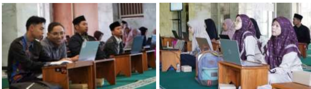
Gambar 1. Pelatihan Praktik Pengelolaan Digital Lembaga

Pendampingan lanjutan dilakukan secara daring untuk memastikan proses adopsi berjalan setelah sesi tatap muka selesai. Tindak lanjut ini mencakup asistensi aktivasi email kelembagaan, pengunggahan konten awal website, penataan profil institusi, serta konsultasi kendala teknis. Pendampingan pascapelatihan penting karena sebagian peserta masih memerlukan bantuan pada tahap implementasi awal, terutama dalam pengelolaan menu website, konsistensi pembaruan informasi, dan pembagian tugas internal, seperti terlihat pada Gambar 1.