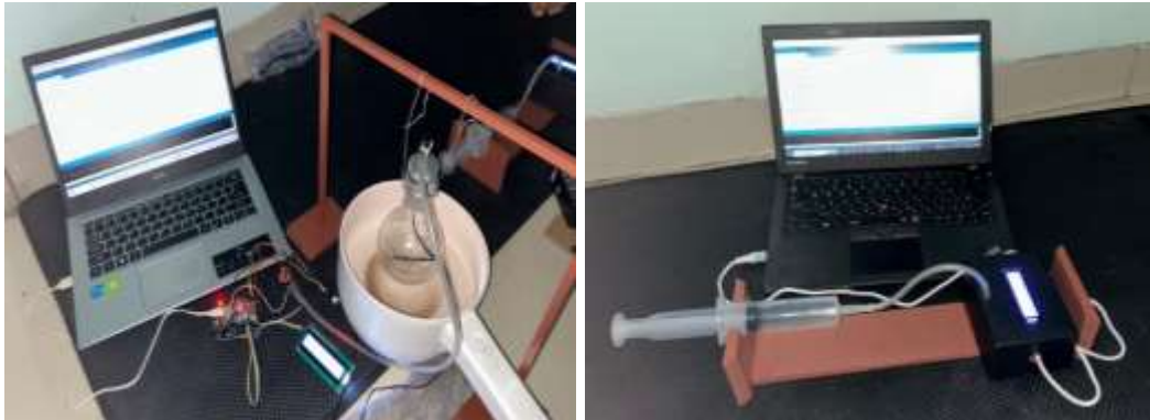
Gambar 1. Alat Eksperimen Termodinamika Terintegrasi IoT

Teknologi yang dihasilkan dari kegiatan pelatihan ini berupa dua jenis alat eksperimen, yaitu alat eksperimen Hukum Gay-Lussac dan Hukum Boyle terintegrasi IoT. Selanjutnya, alat-alat tersebut diuji coba dengan memanaskan labu didih pada percobaan Hukum Gay-Lussac serta menekan suntikan pada percobaan Hukum Boyle, sambil mengamati perubahan tekanan, suhu, dan volume melalui aplikasi Blynk, dimana setiap perubahan parameter akan ditampilkan dalam bentuk pergerakan pada aplikasi tersebut. Alat eksperimen Hukum Gay-Lussac bekerja berdasarkan prinsip bahwa suhu gas berbanding lurus dengan tekanan gas, sedangkan alat eksperimen Hukum Boyle didasarkan pada prinsip persamaan tekanan gas berbanding terbalik dengan volume. Ilustrasi teknologi yang dikembangkan seperti pada Gambar 1 berikut.