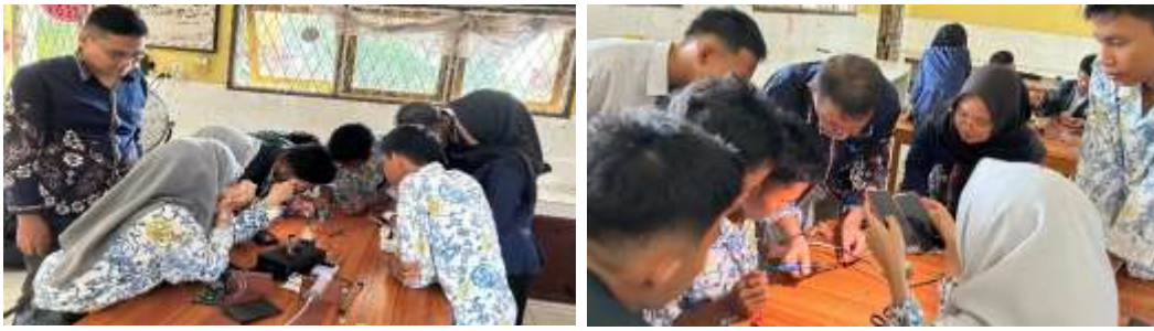
Gambar 2. Pembuatan Alat Eksperimen Termodikamika Terintegrasi IoT