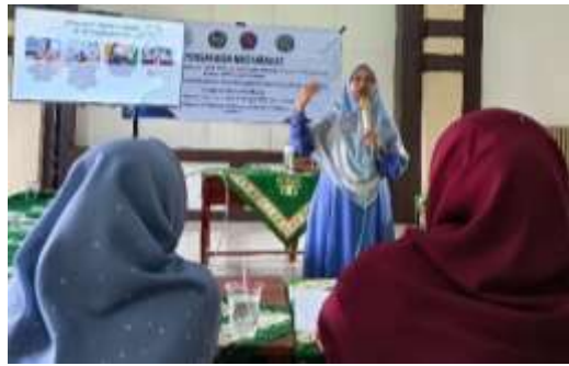
Gambar 1. Penyampaian Materi PkM kepada Guru dan Pengurus Bahasa Arab terkait Penguatan Program Bi'ah Lughawiyah

Materi pelatihan meliputi pengenalan isi panduan, strategi pembiasaan Bahasa Arab, pemanfaatan media ajar, serta peran pengurus dalam menjaga keberlangsungan kegiatan bahasa. Setelah pelatihan, tim pelaksana melakukan pendampingan secara langsung agar mitra dapat menerapkan program sesuai dengan rancangan yang telah disusun baik kepada pelaksana maupun sasaran peserta (santri).