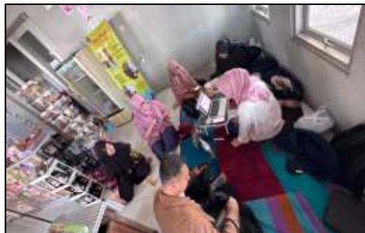
Gambar 3. Pendataan UMKM

Tabel 1 menunjukkan adanya peningkatan signifikan pada aspek legalitas produk dan pemahaman pelaku UMKM setelah kegiatan pendampingan. Pada kondisi awal, terdapat 6 UMKM dengan 13 produk yang belum memiliki izin P-IRT. Setelah kegiatan, seluruh produk tersebut (100%) berhasil memperoleh izin P-IRT. Selain itu, terjadi peningkatan pemahaman pelaku UMKM terkait prosedur pengurusan P-IRT dan pemenuhan standar pelabelan produk, yang menjadi indikator keberhasilan kegiatan dalam meningkatkan legalitas dan daya saing UMKM. Pelaku UMKM mulai memahami bahwa legalitas produk dan kemasan yang informatif merupakan bagian penting dalam membangun kepercayaan konsumen serta meningkatkan daya saing produk di pasar yang semakin kompetitif (Wahyu et al., 2023; Wulandari & Putri, 2023), seperti terlihat pada Gambar 3.