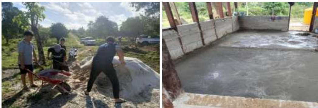
Gambar 3. Pembuatan Lantai Kerja Beton.

Pada Gambar 3 yaitu proses pengerjaan yaitu mengumpulkan bahan seperti pasir, kerikil, semen dan air untuk disatukan dan diaduk menjadi sebuah beton, kemudian menentukan Tingkat kedataran atau perbedaan tinggi dengan menggunakan selang water pass sehingga didapatkan tinggi elavasi lantai yang akan di cor kemudian mengghampar adukan beton secara merata secara keseluruhan. Dengan terpasangnya lantai tempat ibadah, tempat ibadah ini sudah layak digunakan untuk beribadah oleh jemaat Pantekosta Filai Delfia Bomberay Fakfak.