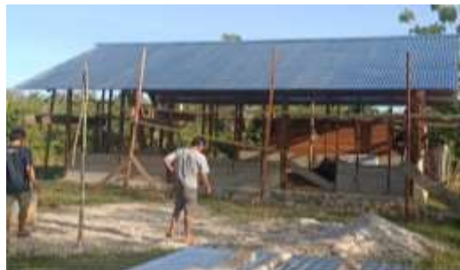
Gambar 1. Kondisi Tempat Ibadah Filai Delfia Bomberay Kabupaten Fakfak.

Di Bomberay Kabupaten Fakfak Provinsi Papua Barat berdasarkan hasil pengamatan tempat ibadah jemaat Filai Delfia, terlihat progress pembangunan belum terselesaikan terlihat dinding gedung belum terpasang, lantai gedung belum terpasang serta plafon belum ada dan plasteran dinding tempat ibadah belum ada, seperti terlihat pada Gambar 1.