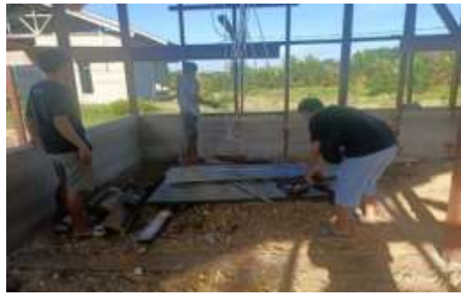
Gambar 2. Pembersihan Tempat Ibadah Pantekosta Filai Delfia Bomberay Fakfak.

Terlihat dari gambar dua proses pembersihan puing sisa bangunan, Kegiatan pembersihan tempat ibadah dilaksanakan dengan membersihkan sisa sampah bangunan yaitu mengangkat sampah kayu, seng yang berserahkan dan meratakan elevasi tanah yang akan di lakukan pengecoran lantai kerja beton. Dengan bersihnya tempata ibadah warga Jemaat Gereja Pantekosta Filai Delfia Bomberay Fakfak dapat beribadah dengan nyaman.