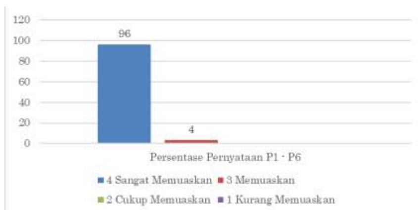
Gambar 5. Grafik Penilaian Kepuasan Mitra Terhadap Kegiatan PKM

Pada Gambar 4 hasil survei bahwa total pernyataan dari sangat tidak suka, tidak suka, agak tidak suka, biasa saja, agak suka, suka dan sangat suka kegiatan PKM Pemasangan lantai beton dan pembersihan sisa material Pembangunan tempat ibadah untuk indikator pembersihan material dengan kategori suka sebanyak 11% dan kategori pembersihan sangat suka sebanyak 89% dan untuk pemasangan lantai beton kategori suka sebanyak 22 persen dan kategori sangat suka sebanyak 78%, dari hasil survey ini menunjukkan bahwa jemaat Pantekosta Filai Delfia Bomberay merasa puas dan sangat suka dengan kegiatan pelaksanaan PKM pemasangan lantai beton dan pembersihan sisa material tempat ibadah.